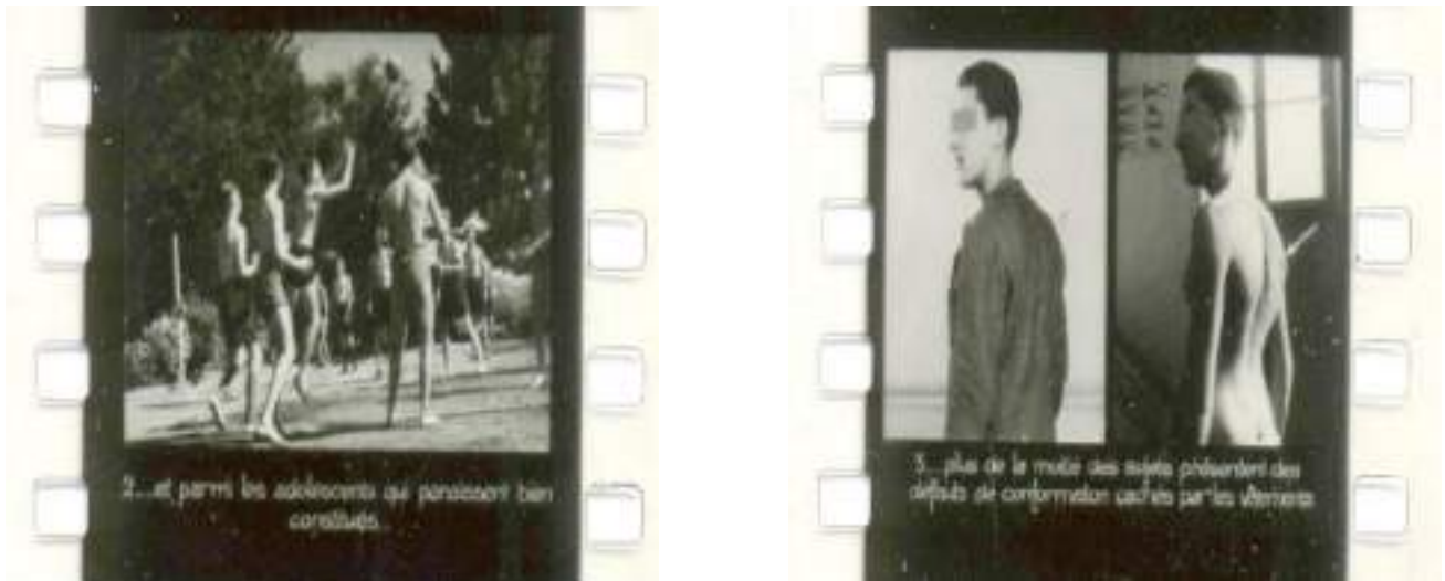
Figuras 1 e 2

A maioria dos documentos sobre essa temática provêm de uma coleção denominada A medicina a serviço do esporte , no interior da qual alguns se intitulam, por exemplo, A Ginástica Corretiva: sua importância na Educação Física . Os documentos apontam sempre, desde o início, as condições originais nas quais se produzem posturas defeituosas as quais convém corrigir (daí o nome de “ginástica corretiva”). Eles também apontam para o fato de que é difícil detectá-las sem uma inspeção racional e séria dos corpos, sobre a qual a medicina exploratória e preventiva pode se pronunciar. De fato, nem sempre é possível perceber, sem instrumento preciso e observação metódica, as deformidades de crianças e adolescentes.