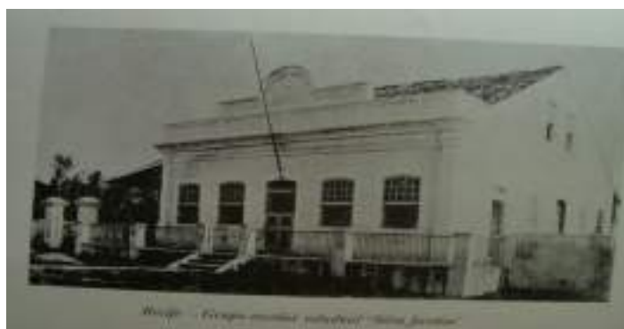
Figura 4: Grupo Escolar Silva Jardim, localizado no Bairro Poço da Panela.