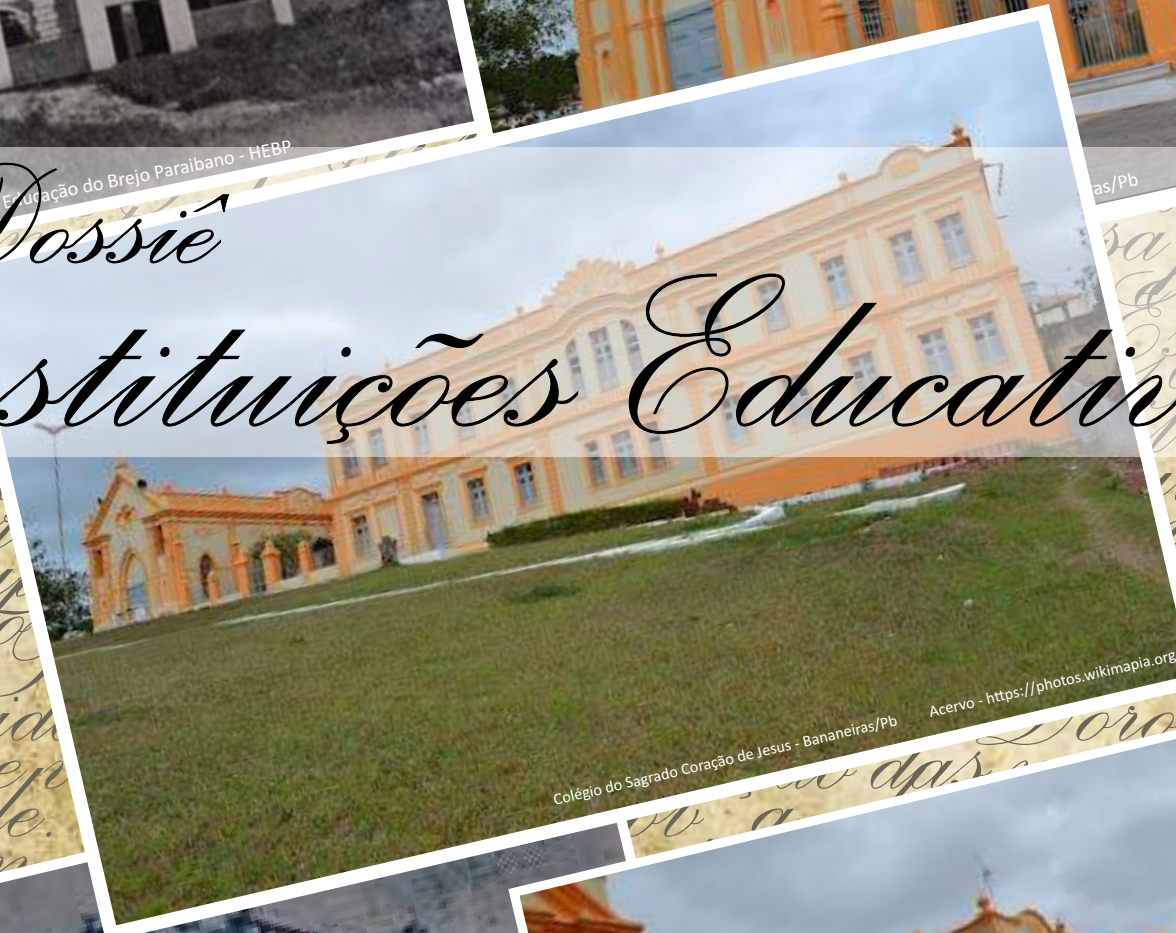
Colégio do Sagrado Coração de Jesus - Bananeiras/Pb