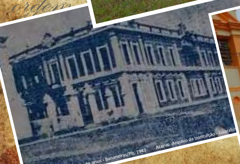
de Jesus - Bananeiras/Pb, 1943