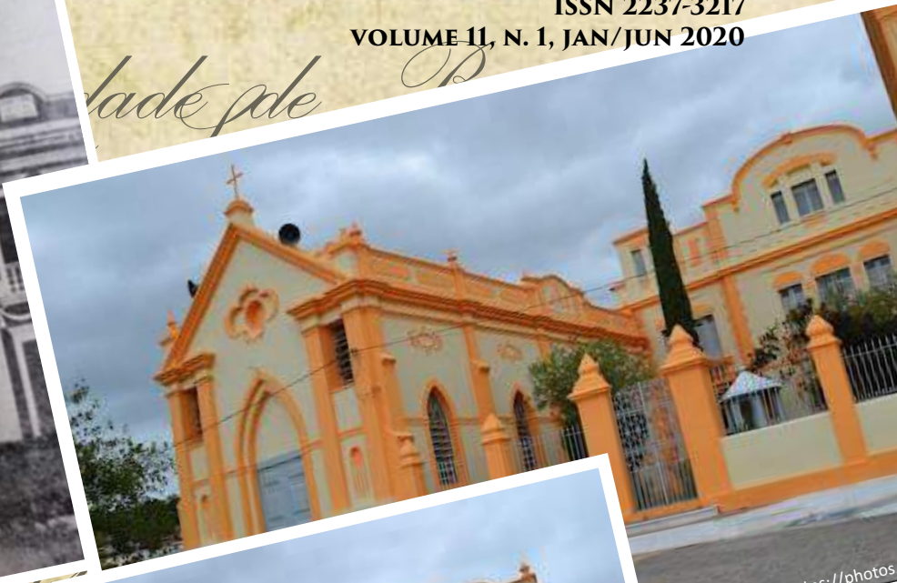
cidade de P