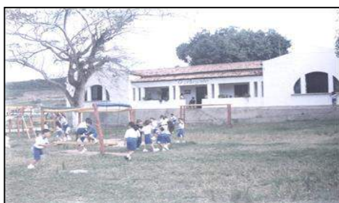
Imagem 1 - Foto 1996.

A Escola de Educação Infantil O Grãozinho , como já fora mencionado, foi fundada em 1980 em reunião realizada pelo Conselho do Centro de Formação de Tecnólogos (CFT), atual CCHSA. A instituição funcionou (e ainda funciona) em um prédio de pequeno porte, estruturado à época com: 1 Sala de aula, 1 Sala de brinquedos, 1. Sala de multimídias, 1. Sala de leitura, 1 Sala de professores e coordenação pedagógica, 1 Cozinha, 2 Banheiros (1 adulto e 1 infantil), 1. Almojarifado, 1. Sala de secretaria e direção 8 .