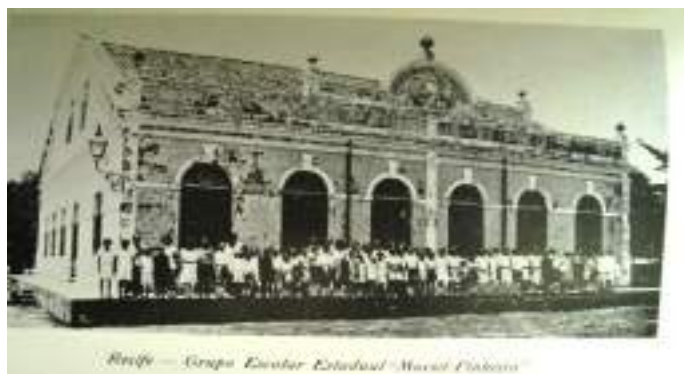
Figura 3: Grupo Escolar Maciel Pinheiro, localizado no Bairro da Encruzilhada –Recife.