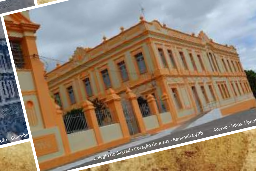
Colégio do Sagrado Coração de Jesus - Bananeiras/Pb