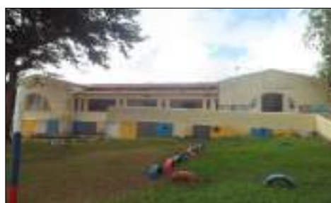
Imagem 2 - Foto 2019.