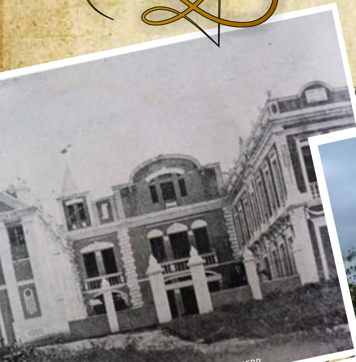
Grupo de Pesquisa História da Educação do Brejo Paraibano - HEBP

ISSN 2237-3217 VOLUME 11, N. 1, JAN/JUN 2020