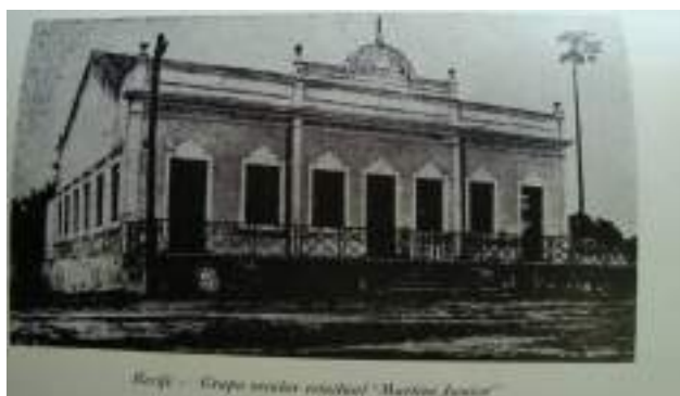
Figura 1: Grupo Escolar Estadual Martins Junior, localizado no Bairro da Torre.