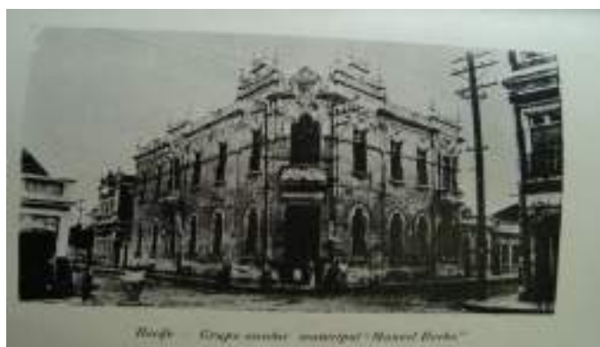
Figura 8: Grupo Escolar Municipal Manoel Borba, Localizado no Bairro da Boa Vista, Recife.