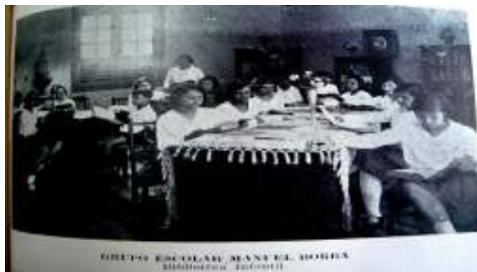
Figura 9: Grupo Escolar Manoel Borba – Biblioteca infantil.