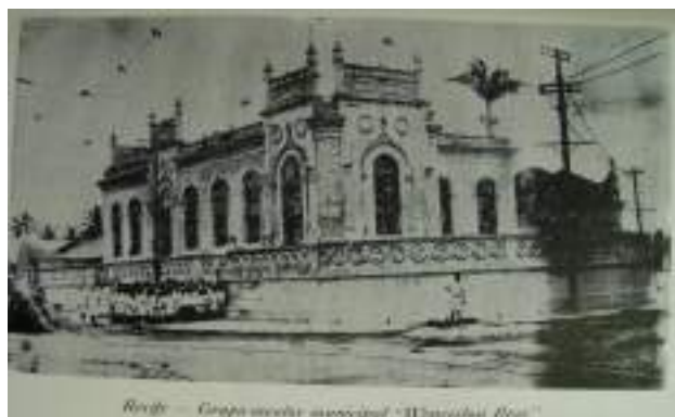
Figura 7 Grupo Escolar Municipal Wenceslau Braz, Recife.