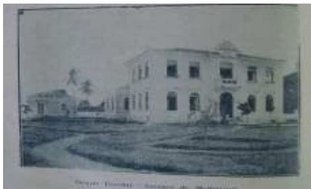
Figura 5: Grupo Escolar Amaury de Medeiros.