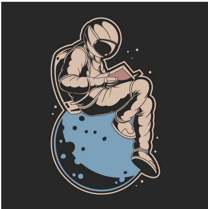
Fig. 4 – Exemplo de imagem associada a resposta ao Enunciado 2