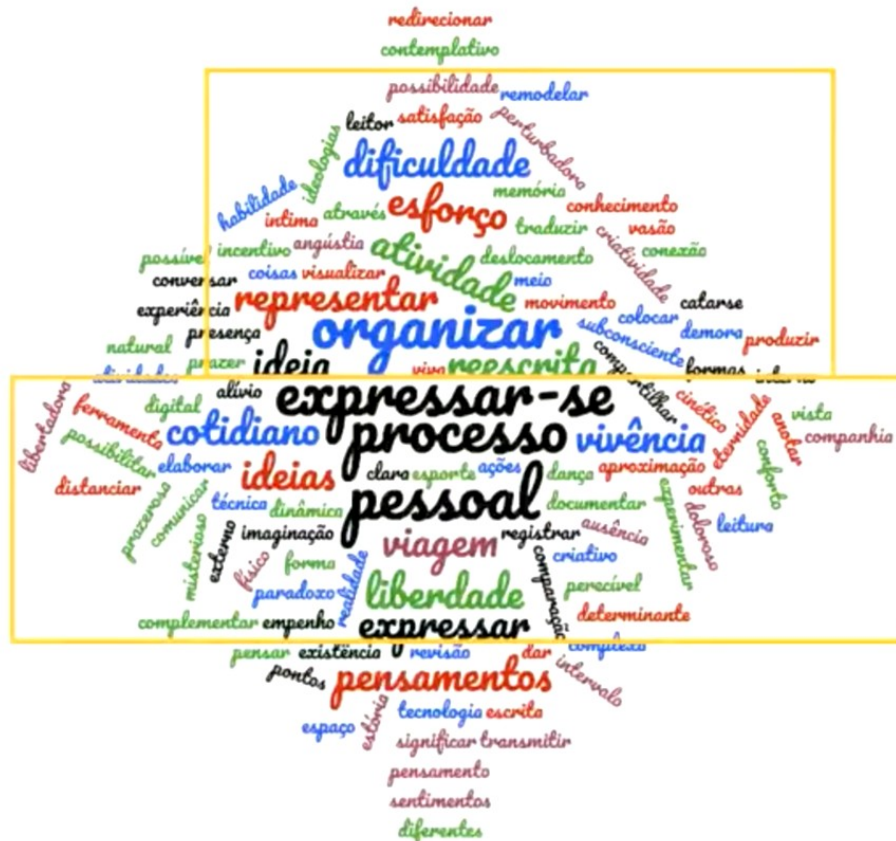
Fig. 1 - Mapa geral das respostas ao Enunciado 1

A nuvem reproduzida na Figura 1, a seguir, é resultado do mapeamento dos vídeos referentes ao Enunciado 1.