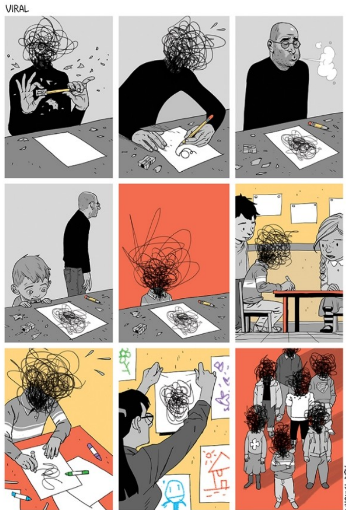
Fig. 2 – Exemplo de imagem associada a resposta ao Enunciado 1