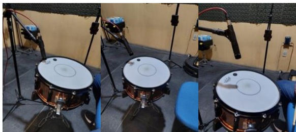
Figura 1 – Microfonação: explorando diferentes posições e timbres.

Discussões críticas sobre aspectos éticos, estéticos e sociais da produção musical foram promovidas, enriquecendo a experiência educacional. Como culminância do curso, os participantes trabalharam na produção de um fonograma inédito, permitindo-lhes aplicar e finalizar tecnicamente seus projetos com base nos conhecimentos adquiridos. O fonograma resultado desta ação, foi uma música produzida colaborativamente e será lançada nos próximos dias (até a submissão deste texto há previsão de lançamento pós-carnaval, já podendo ter sido lançadas nas diversas plataformas de streamings existentes).