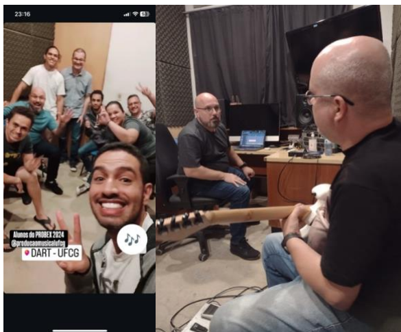
Figura 3 – Dia de aula e gravação de guitarra

Este curso não apenas buscou ampliar horizontes criativos, mas também fortalecer a comunidade musical, destacando o valor inestimável da colaboração e do diálogo crítico em ambientes de aprendizagem. A música final, simboliza a essência do curso: a capacidade de transformar conhecimento em criação artística e mercadológica.