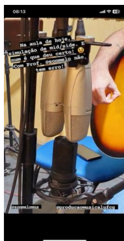
Figura 1 – Microfonação: explorando diferentes microfones e timbres.

prática dos conceitos e técnicas explorados durante o curso.