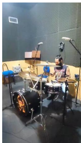
Figura 2 – Microfonação de Bateria.