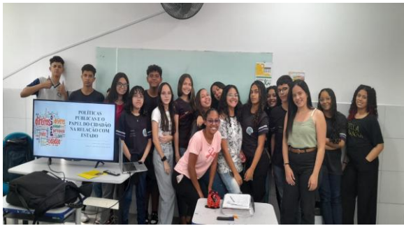
Figura 1 – Jovens Capacitados com o Projeto

Em seguida, houve exposição do material didático, slides, com os conceitos de Gestão Pública, Governo, Estado e Cidadania tendo como base alguns autores da área, porém, com uma linguagem simples e de fácil compreensão para os ouvintes.