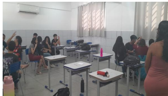
Figura 7 – Encontro de encerramento

No dia 22 de outubro de 2024 foi realizado um último encontro, Figura 7, para realização de dinâmica final sobre todos os assuntos tratados no compartilhamento dos V módulos e encerramento dos encontros com a turma do 9º ano B. Desse modo, foram formados 2 grupos de 6 pessoas e 1 grupo de 5, totalizando 17 alunos, para a realização de atividade.