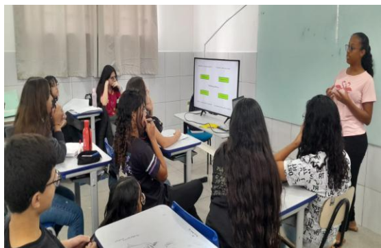
Figura 5 – Compartilhamento do módulo IV

Para finalização do encontro, foram realizadas perguntas aos jovens para uma maior fixação do assunto discutido.