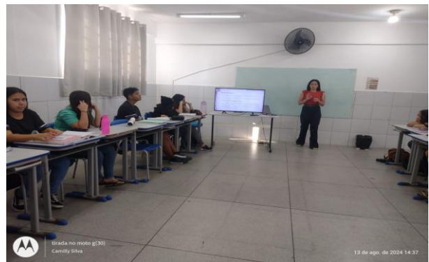
Figura 3– Compartilhamento do módulo II

Para conclusão do encontro, foram realizadas perguntas aos alunos sobre o assunto proposto para uma maior fixação do mesmo, Figura 3.