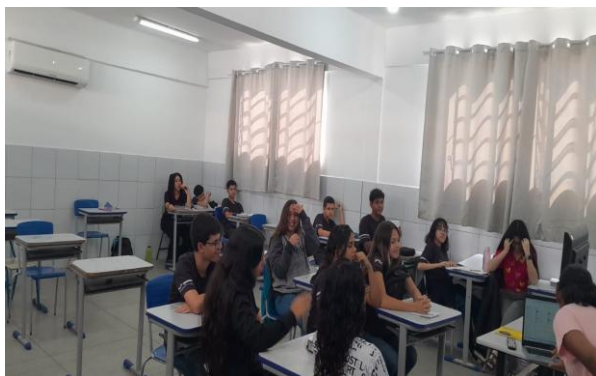
Figura 6 – Compartilhamento do módulo V

O compartilhamento do assunto proposto foi realizado por meio de slides tratando da definição das responsabilidades do estado, a atuação do estado e a definição de bem-estar social. Ao final do encontro, foi iniciada roda de conversa e exposição de exemplos claros e reais sobre a temática tratada.