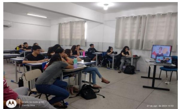
Figura 4 – Compartilhamento do módulo III

Após exposição do vídeo, Figura 4, foi realizada roda de conversa com os jovens, onde eles puderam dialogar sobre o que aprenderam com o material exposto e tirar dúvidas. Durante os diálogos, como forma de complemento ao vídeo, as extensionistas responsáveis pela execução do módulo relataram exemplos claros e próximos à realidade dos alunos referentes aos três poderes e suas responsabilidades, para que os mesmos pudessem fazer uma relação entre o que aprenderam no encontro e o que veem no dia a dia.