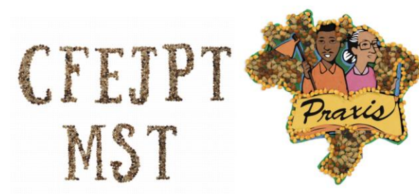
Figura 6 – Resultado após tratamento final de imagem e colorização do novo logotipo.

Desenvolvimento de Elementos Visuais Originais: Os membros do CFEJPT coletaram folhas do próprio território, as quais foram secadas e depois pintadas a fim de criar estampas exclusivas que representassem a identidade do local.