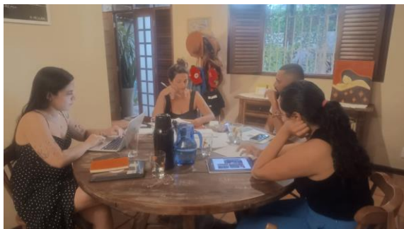
Figura 2 – Reunião de co-criação com os extensionistas e os coordenadores do CFEJPT.

Oficinas de Design Colaborativo: Sessões de cocriação com membros da coordenação do Centro, para resgatar elementos visuais relacionados ao território e desenvolver soluções de identidade visual e portfólio.