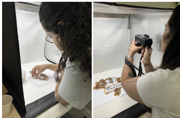
Figura 5 – Registro do desenvolvimento da tipografia com sementes fornecidas pelo CFEJPT no estúdio do D4Human Lab.

Desenvolvimento de Tipografia com Materiais utilizados no CFEJPT: Foi desenvolvida uma nova tipografia utilizando sementes, algo presente recorrentemente nas ornamentações do Centro, de modo a aproximar elementos cotidianos do MST ao material gráfico proposto.