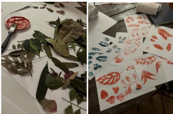
Figura 7 – Processo de estampagem manual das folhas.