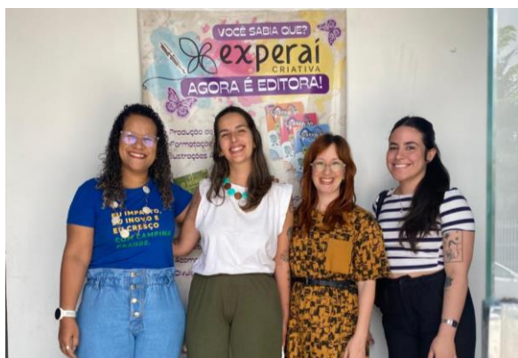
Figura 9 – Visita a gráfica Experaí Criativa.

Processo de impressão: A fim de entregar o material impresso para facilitar o objetivo principal do portfólio – apresentação do Centro para captação de recursos, realizamos uma parceria com a gráfica Experaí Criativa, que realizou uma tiragem de 4 exemplares.