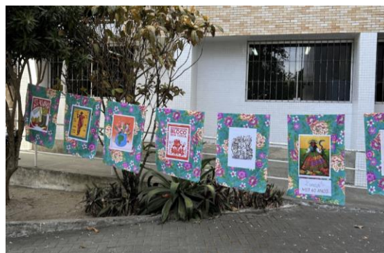
Figura 4 – Registro da montagem da Exposição em Comemoração aos 40 anos do MST, localizada na UFCG.

Desenvolvimento de Tipografia com Materiais utilizados no CFEJPT: Foi desenvolvida uma nova tipografia utilizando sementes, algo presente recorrentemente nas ornamentações do Centro, de modo a aproximar elementos cotidianos do MST ao material gráfico proposto.