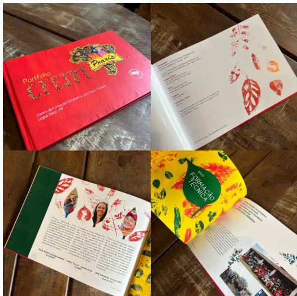
Figura 13 – Resultado final do portfólio impresso em tamanho A4, contendo 60 páginas.

social e cultural, fortalecendo os laços entre a universidade e a comunidade.