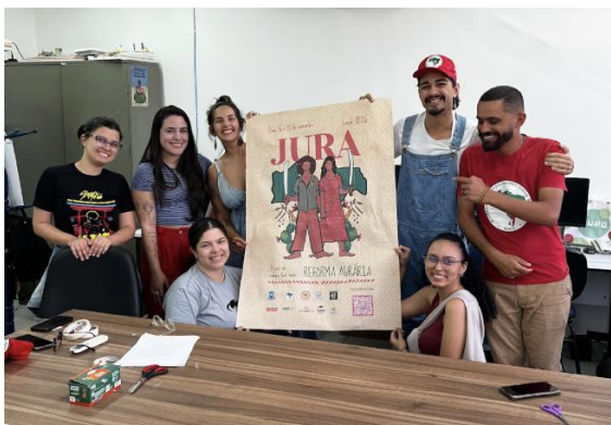
Figura 3 – Identidade Visual Produzida para JURA e produção de cartaz em colaboração com membros da organização.

Imersão em outras atividades do CFEJPT: Os alunos extensionistas colaboraram paralelamente com a produção de material gráfico para outras atividades organizadas pelo centro, como a JURA (Jornada Universitária pela Reforma Agrária) ocorrida na UFCG em novembro de 2024. Nessa oportunidade, além de uma identidade visual foram criados também suportes físicos para uma exposição itinerante de obras artísticas em comemoração aos 40 anos do MST.