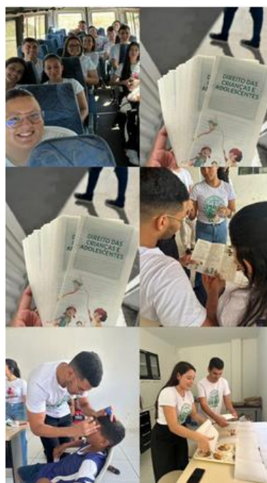
Figura 3: Imagens das nossas diversas ações