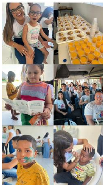
Figura 4: Imagens das nossas diversas ações