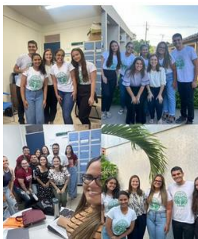
Figura 1: Imagens das nossas diversas reuniões

Esse crescimento demonstra a eficácia da iniciativa na popularização do Direito e na consolidação da extensão universitária da UFCG, contribuindo para a formação acadêmica dos discentes e para o fortalecimento do vínculo entre a universidade e a comunidade.