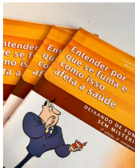
Figura 4 - Material utilizado em ação educativa