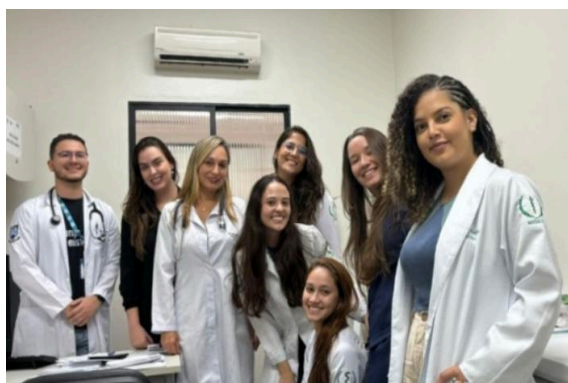
Figura 3 – Atendimento Ambulatorial.