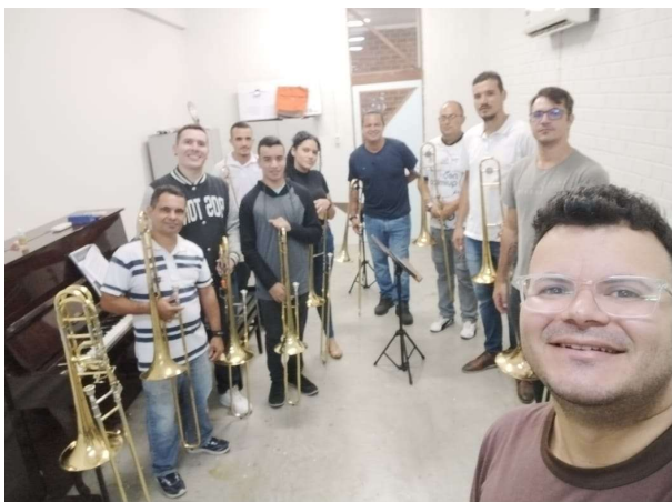
Figura 1 – Registro de atividade Curso de Extensão em Trombone

Esta propagação de conhecimento para distintas cidade faz com que o processo seja replicado visto o sucesso que a prática realizou.