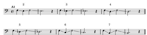
Figura 2 – Exercício horizontal (glissandos)

Horizontal Estudos aplicados basicamente com o uso de glissandos e/ou legato natural. A sistema de embolo do instrumento deve correr arrastada por posições onde o discente deverá manter a consistência da coluna de ar para não haver quebra ou oscilação de volume.