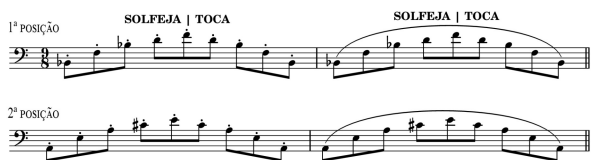
Figura 3 – Exercício vertical (arpejo)

Diagonal Estudos que tem como base a união das duas formas anteriores o que resulta em escala, para tal utilizamos o estudo de uma escala maior e sua relativa menor (harmônica). Inicialmente de forma ascendentes e descendentes.