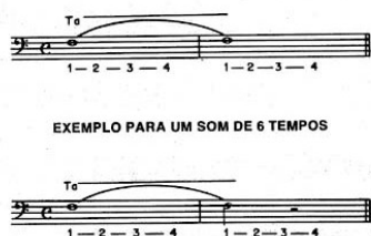
Figura 5 – Exercício sobre Emissão de Som