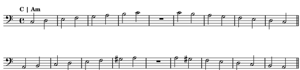
Figura 4 – Exercício Diagonal (Escala)

Diagonal Estudos que tem como base a união das duas formas anteriores o que resulta em escala, para tal utilizamos o estudo de uma escala maior e sua relativa menor (harmônica). Inicialmente de forma ascendentes e descendentes.