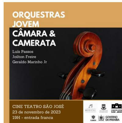
Imagem 5: Cartaz do concerto das orquestras. Novembro de 2023