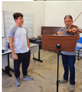
Imagem 3: Registros das aulas de violino Prof. Joilton Freire