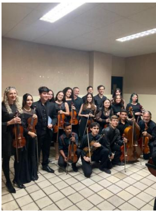
Imagem 3: Recital da Orquestra. Teatro Severino Cabral.