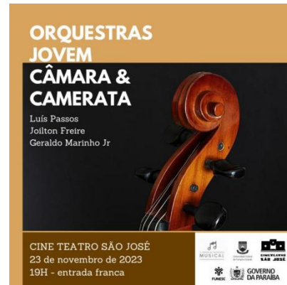
Imagem 5: Cartaz do concerto das orquestras. Novembro de 2023