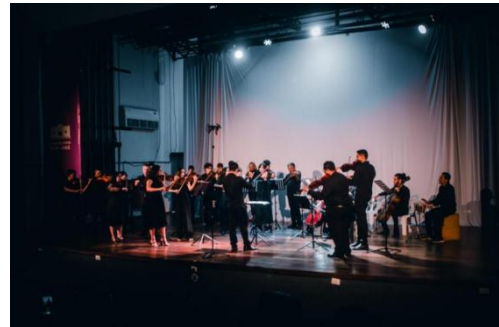
Imagem 6: Recital das orquestras no CineTeatro São José. Novembro de 2023