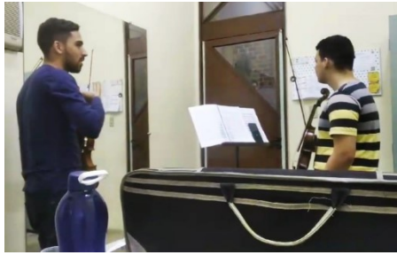
Imagem 1: Aula de violino da extensão. Monitor e aluno conversam sobre técnica.