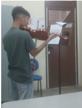
Imagem 2: Aula de violino da extensão. Aluno praticando exercícios.