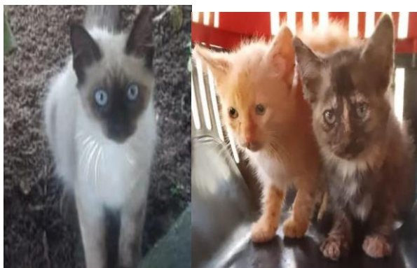
Figura 8 – Gatinhos adotados