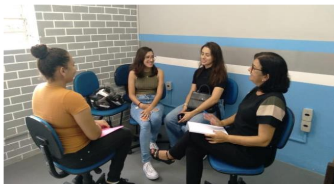
Figura 2 – Reunião mensal com equipe executora