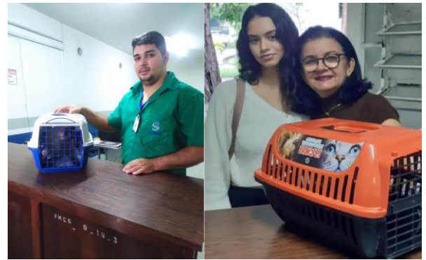
Figura 9 – Caixas de transportes doadas