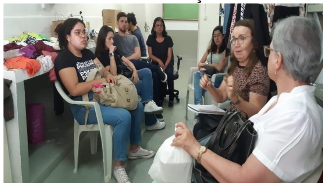
Figura 1 – Primeira reunião com equipe executora