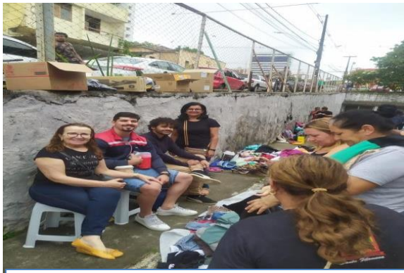
Figura 5 – Bazar e Atividade educativa na feira da Prata