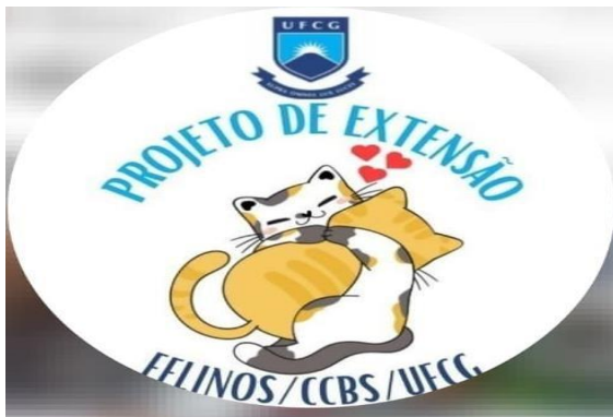
Figura 7 – Criação do instagran