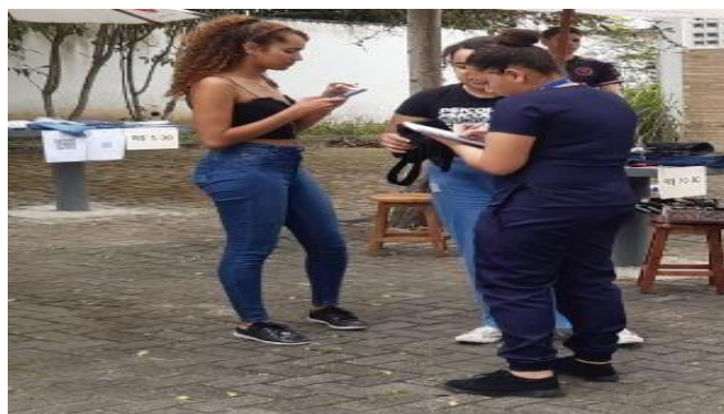
Figura 3 – Atividade educativa com público externo no CCBS/UFCG.