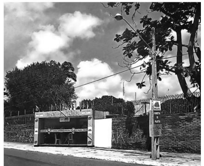
A Casa Nilo Coelho estava localizada na Av. Beira Rio, no bairro da Ilha do Retiro, em Recife, e foi demolida para dar lugar a um edifício