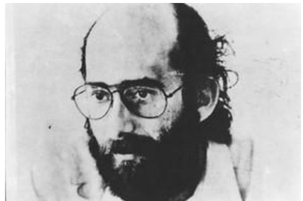
O arquiteto Armando de Holanda.

Engajado nos estudos sobre industrialização na arquitetura, em 1967, viajou para Roterdã, na Holanda, onde passou seis meses realizando um curso de especialização em protótipos desenvolvido no "International Course on Building", no Bouwcentrum em Roterdã, Holanda (Silva, 1997, pág. 66).