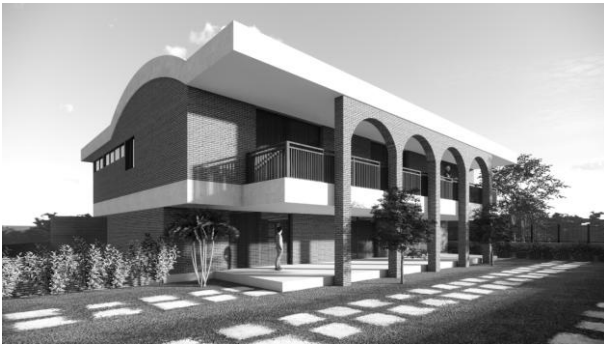
Casa Nilo Coelho.1976.

Este estudo das casas de Armando, assim como aqueles apresentados em seus livros “Patrimônio Industrial Arquitetônico de Pernambuco”(Afonso, 2024) , sobre algumas indústrias projetadas por Armando de Holanda, e “Brutalismo em Pernambuco: Guia da Arquitetura nas Décadas Ausentes”(Afonso, 2025) , que apresenta, entre outras obras, o Parque Histórico Nacional dos Guararapes (PHNG) —, é igualmente de grande importância e vem, aos poucos, permitindo um entendimento mais detalhado da produção arquitetônica de Armando de Holanda.