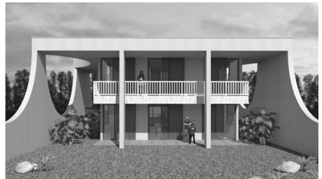
Volumetria da Residência Cicero Morais. s/d.

A pesquisa é criteriosa e apresenta o projeto de cada casa, além de uma análise desenvolvida a partir de uma metodologia estruturada em sete dimensões: histórica, espacial externa, espacial interna, tectônica, funcional, normativa e de conservação.