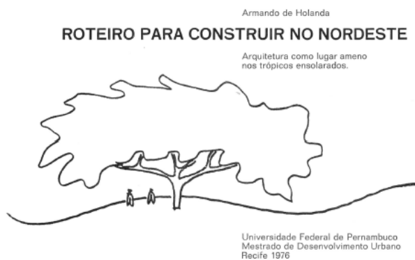
Capa do livro.

Em 1976, publicou o livro "Roteiro para Construir no Nordeste" publicado em 1976, que se tornou uma referência na área, apresentando nove princípios projetuais propostos que foram tratados de forma objetiva e ilustrados com croquis, sintetizando a importância de adotar cada um desses critérios nos projetos arquitetônicos a serem desenvolvidos no Nordeste, tais como: 1) Criar uma sombra; 2) Recuar os muros; 3) Vazar os muros; 4) Proteger as janelas 5) Abrir as portas; 6) Continuar os espaços; 7) Construir com pouco; 8) Conviver com a natureza; 9) Construir frondoso (Holanda, 1976, p.7).