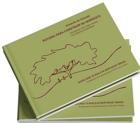
Capa do livro. Fonte: IAHC. Edição do grupal. UFCG, 2025.

ISABEL DE HOLANDA MARQUES: O Roteiro é de grande importância por reconhecer o Nordeste tropical do Brasil como uma realidade geográfica, climática e cultural distinta, analisada e traduzida por Armando em princípios e métodos construtivos fundamentais, a partir de sua formação e de sua experiência como profissional e professor. A publicação também reafirma o valor do Nordeste brasileiro no campo da arquitetura, dando à região a mesma relevância atribuída a outros contextos amplamente estudados, embora muito diferentes da nossa realidade, como os países da Europa e dos Estados Unidos.