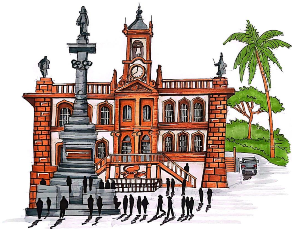
Título: Croqui do uso do espaço público em frente ao Museu da Inconfidência, Ouro Preto

Nesse sentido, o caderno constitui um suporte de reflexão sobre o território vivido, reunindo desenhos que operam como registros de campo, estudos analíticos e dispositivos de leitura da cidade, articulando desenho, pesquisa e pensamento crítico como parte da construção do conhecimento.