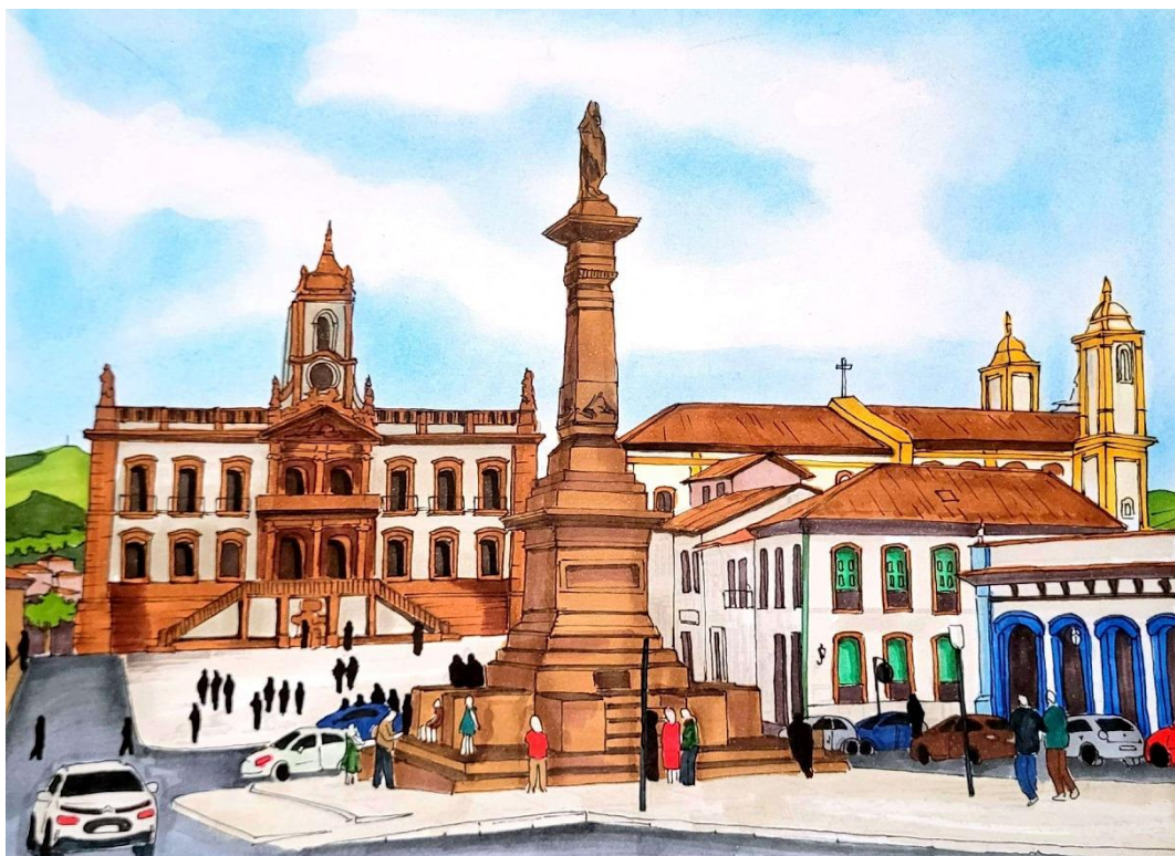
Título: Croqui do uso do espaço público na Praça Tiradentes, Ouro Preto