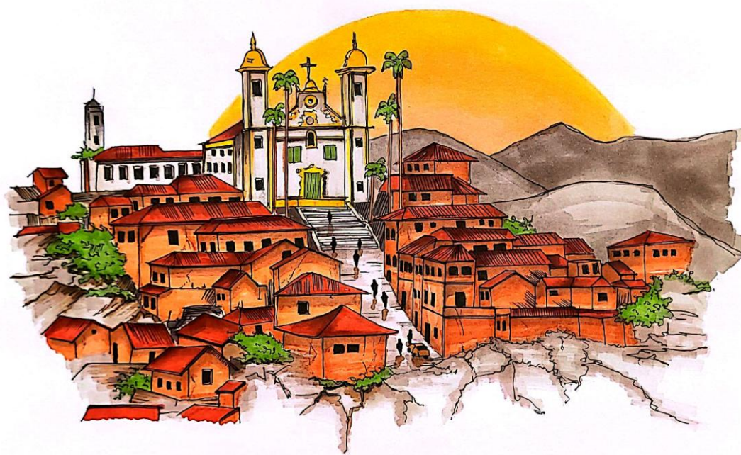
Título: Croqui do uso do espaço público em frente à Igreja de Santa Efigênia, Ouro Preto