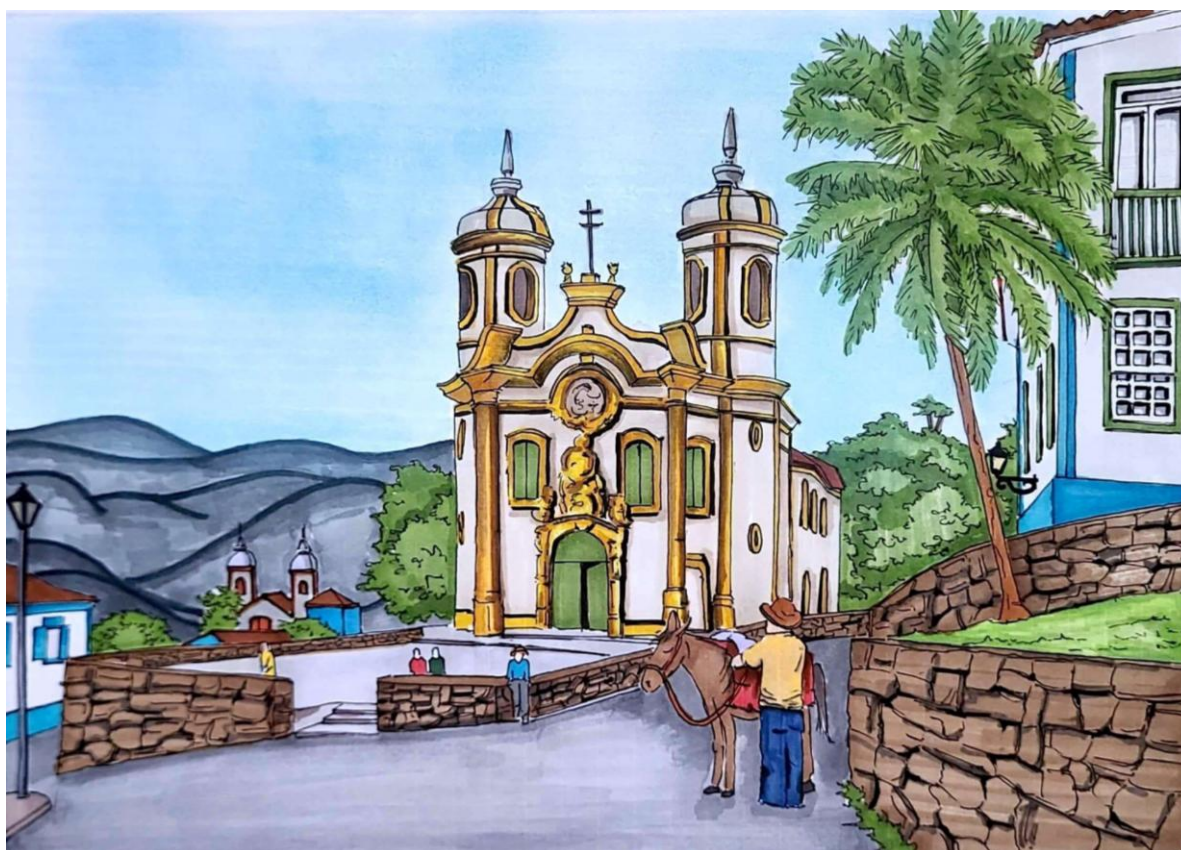
Título: Croqui do uso do espaço público em frente a Igreja São Francisco de Assis, Ouro Preto