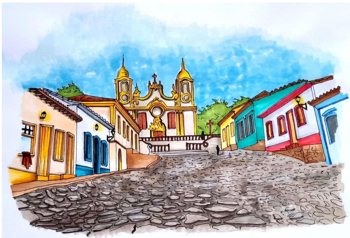
Título: Croqui da conformação urbana na Rua da Câmara com a fachada da Igreja Matriz de Santo Antônio, Tiradentes