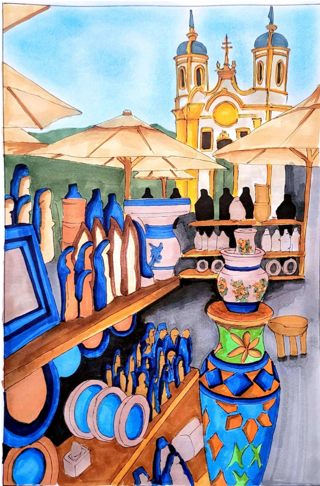
Título: Croqui da apropriação do espaço público na feirinha de pedra sabão, Ouro Preto