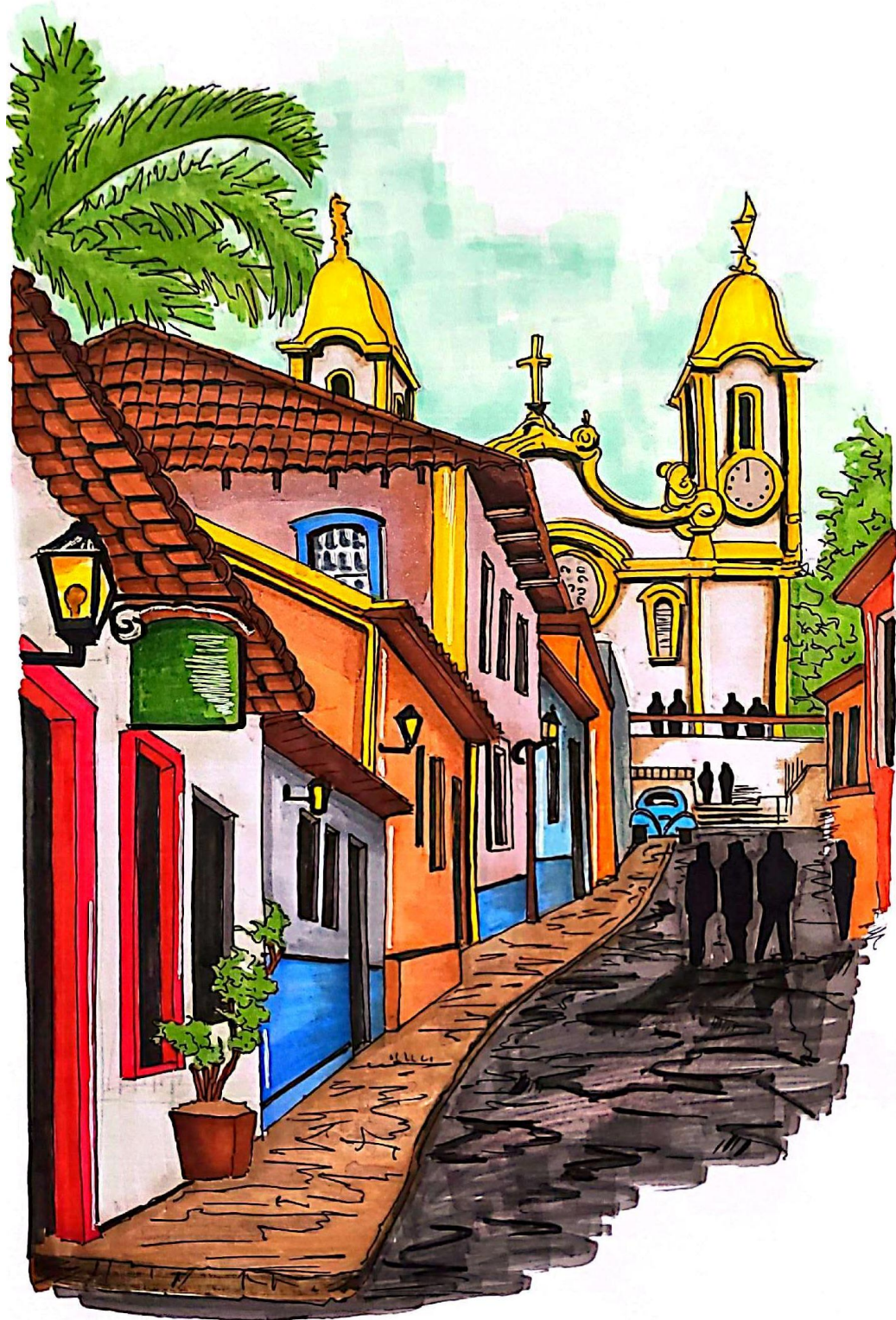
Título: Croqui do uso do espaço público na Rua da Câmara com a fachada da Igreja Matriz de Santo Antônio, Tiradentes.