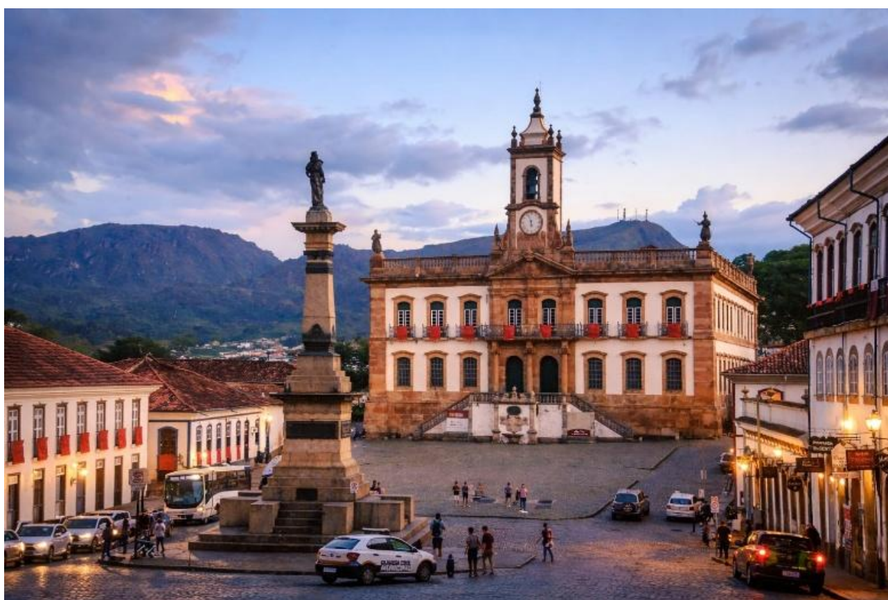
Figura 5 – Configuração atual da Praça Tiradentes, 2026

Desse modo, a passagem do território à paisagem não representa mudança de escala conceitual arbitrária, mas aprofundamento analítico. O que primeiro aparece como monumento e depois como patrimônio urbano, passa a ser lido como espaço vivido, no qual o valor emerge da articulação entre matéria, memória e prática social. A paisagem da Praça Tiradentes não é homogênea nem unívoca; ela é resultado de leituras múltiplas, tensões entre memória oficial e usos cotidianos, e sobreposição de temporalidades. Essa é a contribuição do conceito de patrimônio territorial: mostrar que o valor patrimonial não reside apenas na materialidade consagrada, mas na relação entre espaço, cultura e experiência social.