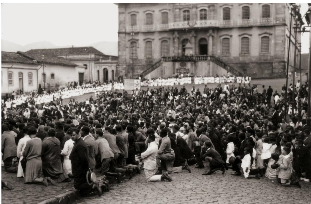
Figura 4 - Praça Tiradentes, início do século XX

Ao registrar a Praça Tiradentes no início do século XX, com presença de manifestações religiosas, transformações no edifício da Câmara e Cadeia e marcas das normativas que incidiam sobre o espaço urbano, a imagem abaixo (Figura 4) nos mostra que a Praça era espaço em que práticas sociais, instituições e usos se sobrepujam. O valor da Praça se produzia na vida ordinária, nas festas, procissões, adaptações funcionais e tensões entre permanência e mudança, ou seja, o patrimônio territorial deve ser pensado em relação ao espaço.