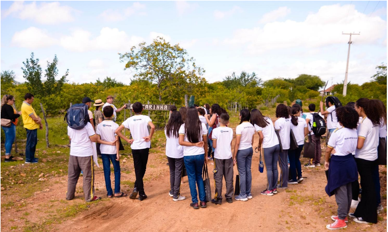
Figura 10: Conversa sobre a caracterização do percurso