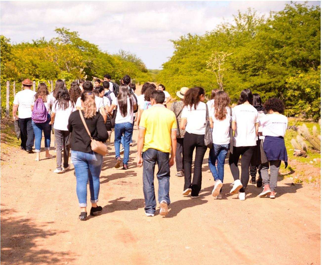
Figura 9: Caminhando pelo “retão”