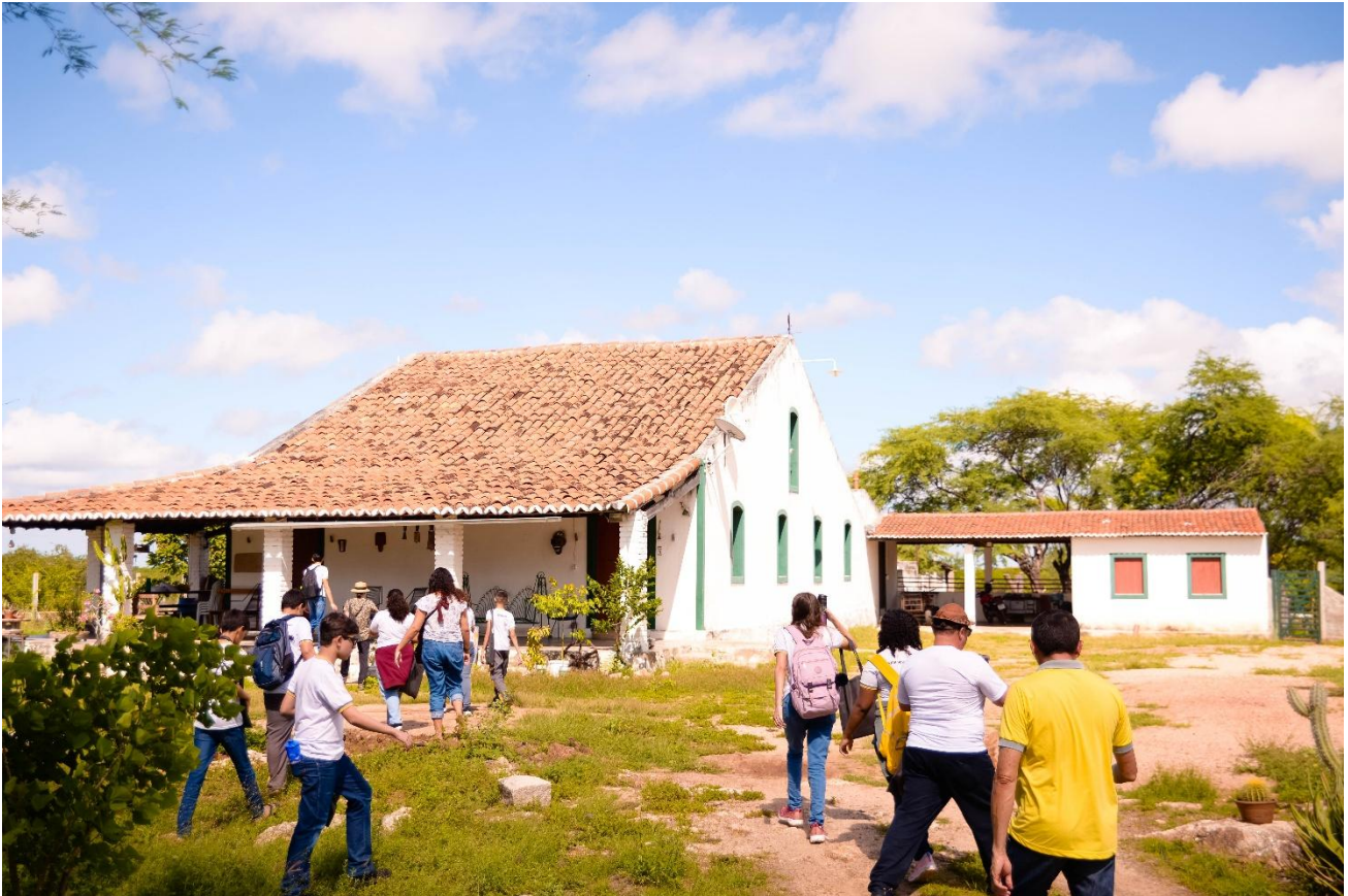
Figura 11: De volta ao espaço residencial