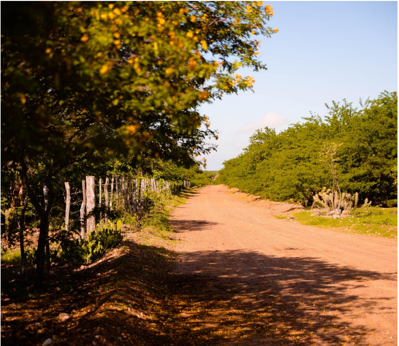
Figura 5: Aspectos do espaço caatinga.