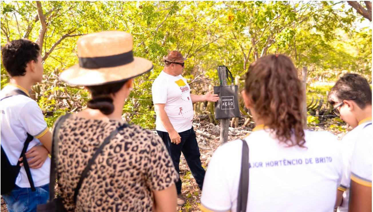
Figura 8: Conversas sobre história, memória e pertencimento