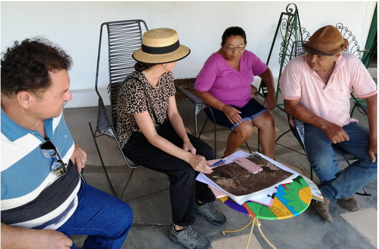
Figura 2: Conversa de alpendre.

O diálogo é uma exigência existencial. E, se ele é o encontro em que se solidariza o refletir e o agir de seus sujeitos endereçados ao mundo a ser transformado e humanizado, não pode reduzir-se a um ato de depositar ideias de um sujeito no outro, nem tampouco tornar-se simples troca de ideias a serem consumidas pelos permutantes. (...) É um ato de criação. Daí que não possa ser manhoso instrumento de que lance mão um sujeito para a conquista do outro. A conquista implícita no diálogo é a do mundo pelos sujeitos dialógicos, não a de um pelo outro. Conquista do mundo para a libertação dos homens. (Freire, 1987, p.51)