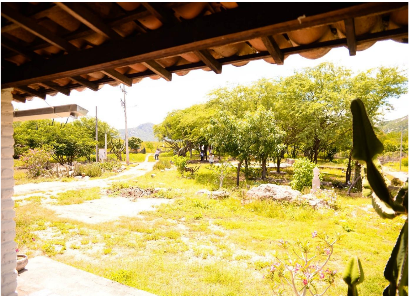
Figura 3: Aspectos do espaço residencial.

A serra da Caiçarinha arremata a configuração deste espaço. A propósito, “Caiçarinha” é o nome atribuído aos pequenos currais na região seridoense, mas também está relacionada ao principal cordão de serra que marca o contexto de inserção desta específica fazenda. Sobre isso, reforça-se que a toponímia no sertão seridoense se liga, com frequência, às estruturas de sua paisagem. Por essa razão, a justificativa acionada pelos moradores para responder à designação da fazenda encontra respaldo na lógica do criatório: “o nome vem do curral. Tem outras fazendas com esse nome e não estão perto da serra” (Silvino Sales Souza, 2023).