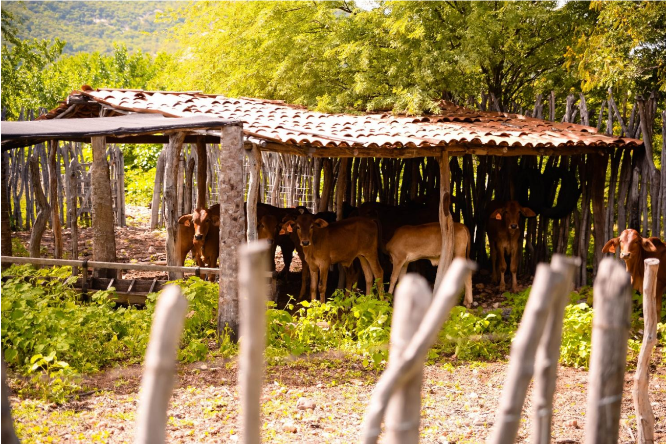
Figura 4: Aspectos do espaço produtivo.

Próximo à casa encontram-se o galinheiro e o curral de bezerros. No caso dos animais de maior porte — vacas e bois — o morador os posiciona nas áreas próximas ao cercado que delimita o espaço residencial da caatinga.