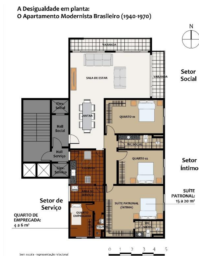
Figura 2: Planta-tipo do apartamento modernista (décadas de 1940-1970) - setorização tripartida, circulações segregadas e quarto de empregada.