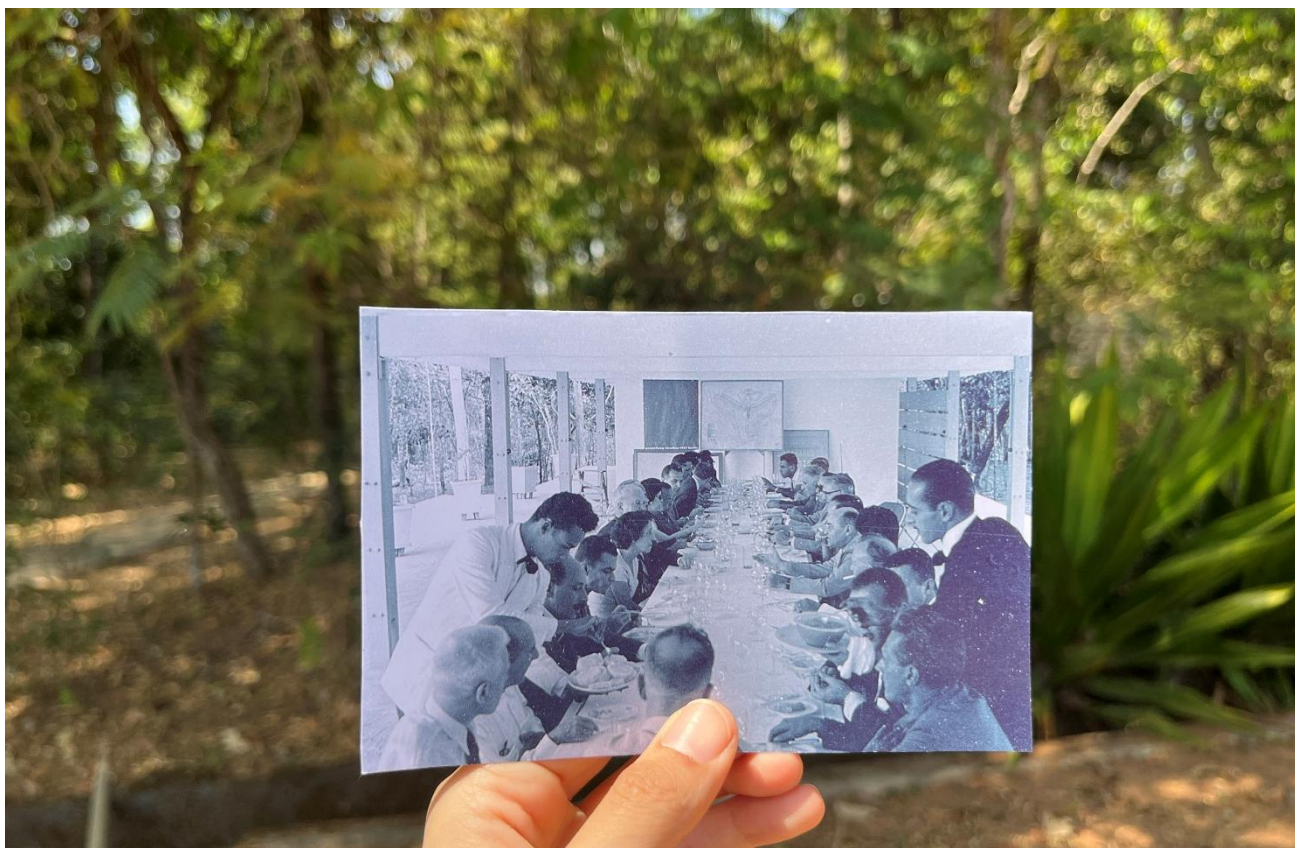
Catetinho 2: o palácio fantasma de Brasília: visitantes reunidos para uma refeição no pilotis do Catetinho 2 ou Catetão.