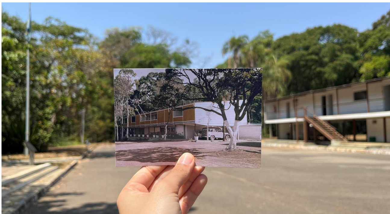
Catetinho 2: o palácio fantasma de Brasília: Catetinho 2 ou Catetão (à esquerda) ao lado do primeiro Catetinho e atual Museu do Catetinho (à direita).