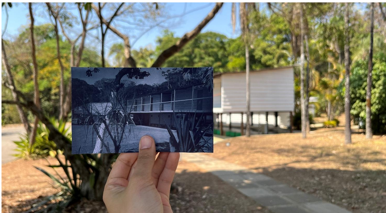
Catetinho 2: o palácio fantasma de Brasília: vista diagonal frontal do primeiro Catetinho e atual Museu do Catetinho (à direita) e o Catetinho 2 ou Catetão ao fundo (à esquerda).