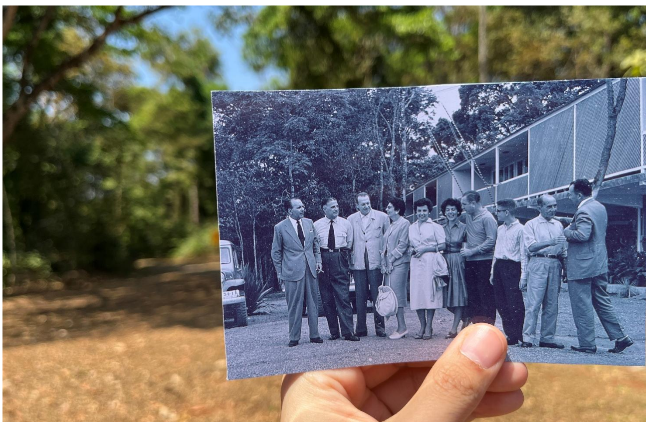
Catetinho 2: o palácio fantasma de Brasília: visitantes na frente do Catetinho 2 ou Catetão.