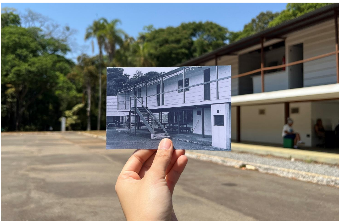
Catetinho 2: o palácio fantasma de Brasília: vista diagonal frontal do primeiro Catetinho e atual Museu do Catetinho (à direita) e parte da fachada lateral do Catetinho 2 ou Catetão ao fundo (à esquerda).