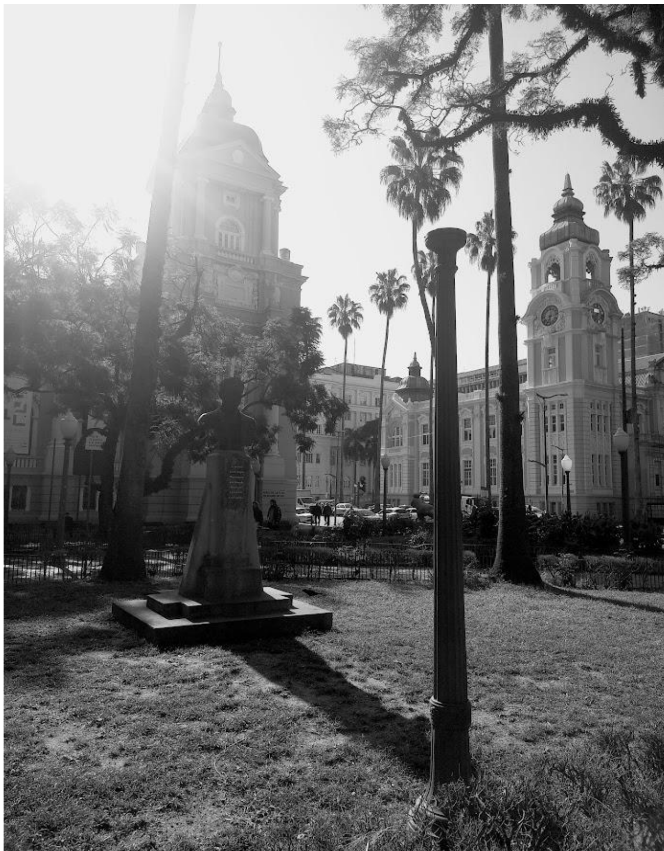
Praça da Alfândega, Museu de Arte do Rio Grande do Sul (MARGS) e Memorial do Rio Grande do Sul