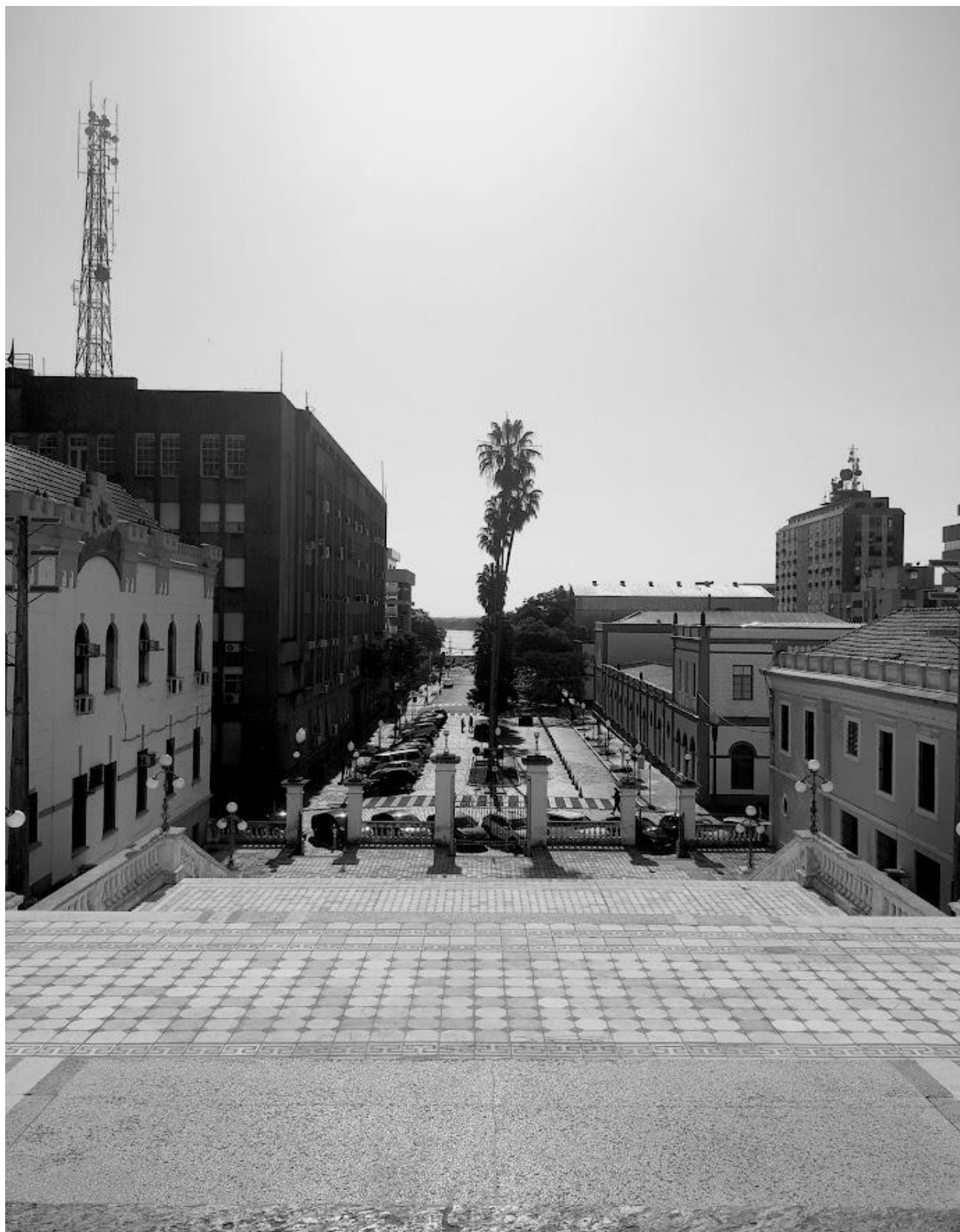
Vista do Guaíba pela Basílica Menor Nossa Senhora das Dores