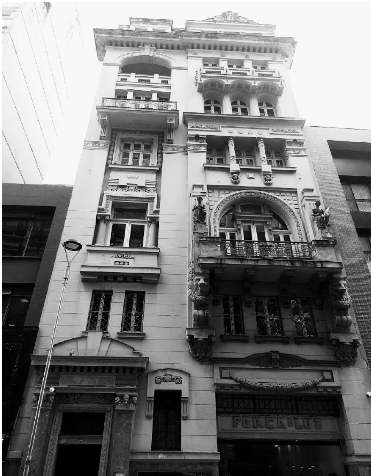
Espaço Força e Luz | Memorial Erico Verissimo e Museu da Eletricidade do RS