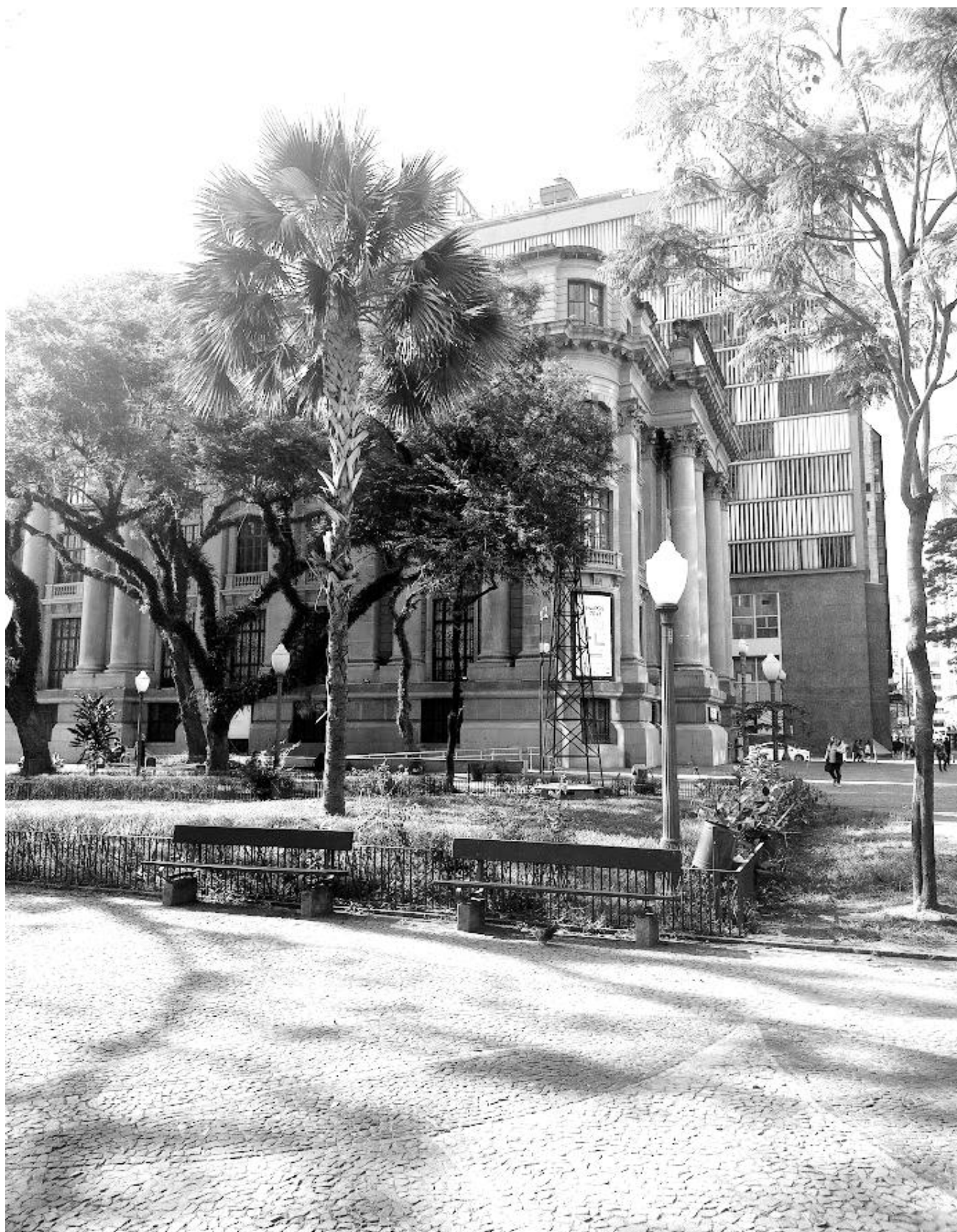
Praça da Alfândega e Farol Santander Porto Alegre