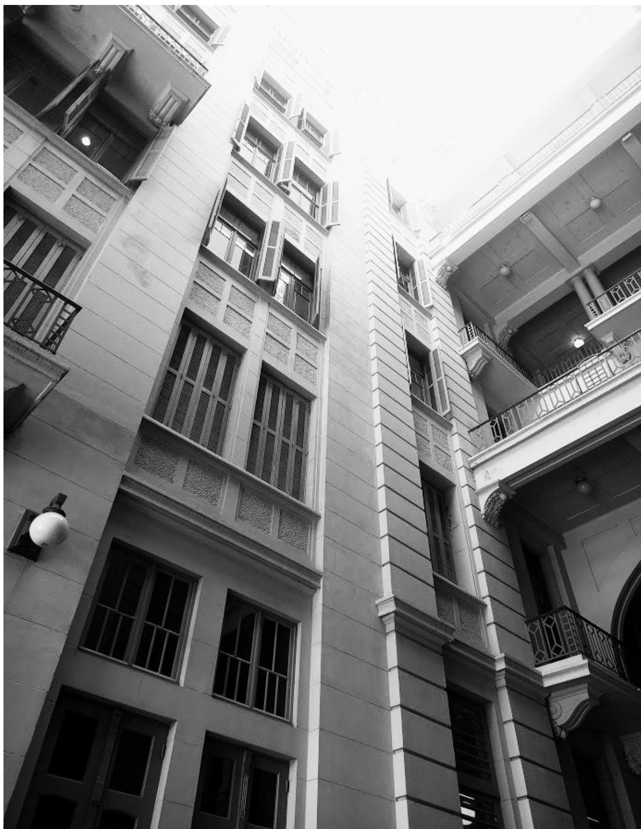
Casa de Cultura Mario Quintana