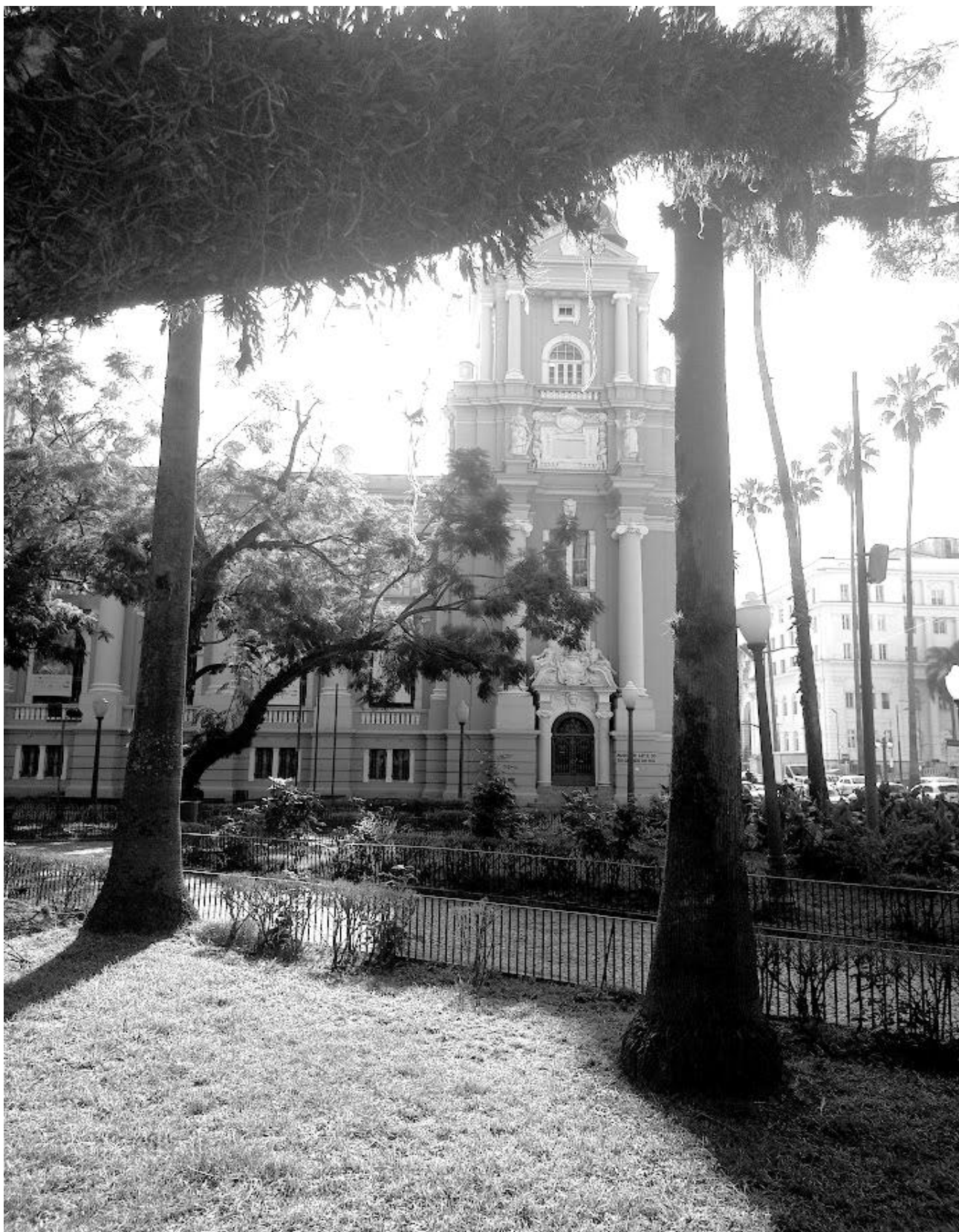
Praça da Alfândega e Museu de Arte do Rio Grande do Sul (MARGS)