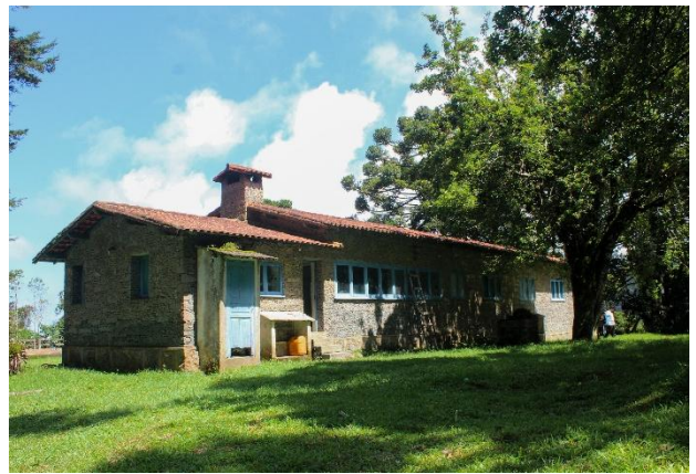
Sólido fluxo. Itamonte – MG.