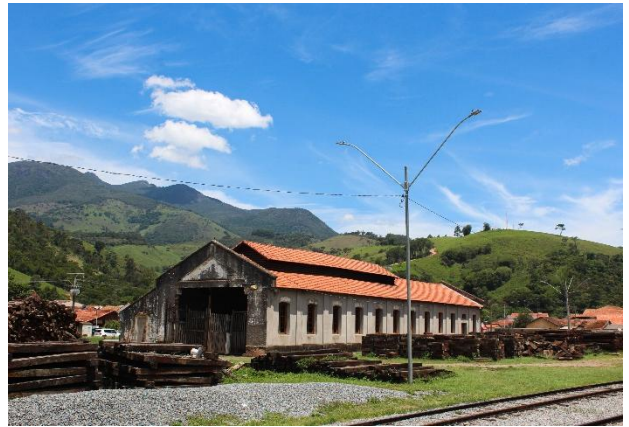
Matéria e tempo. Passa Quatro – MG.