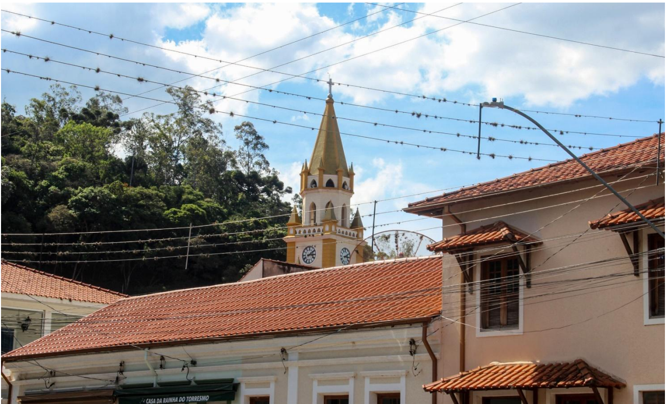
Tessitura. Passa Quatro – MG.