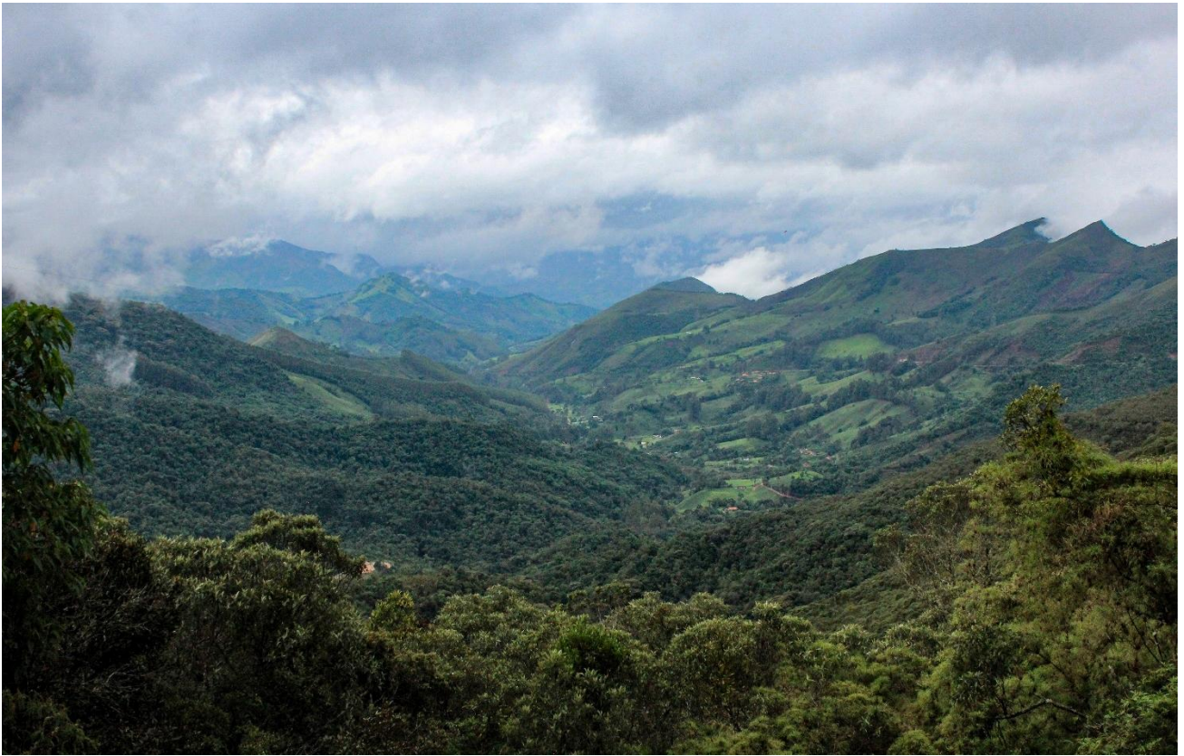
Vastidão da paisagem recortada pelo olhar. Itamonte – MG.