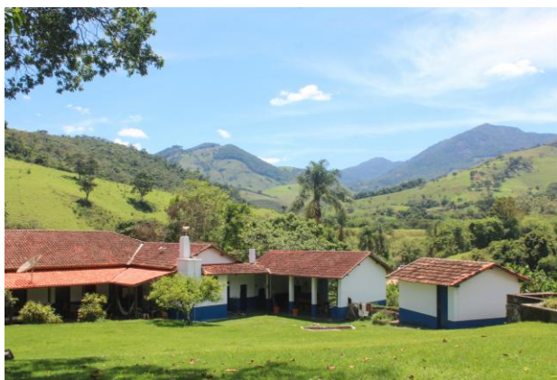
Conjunto guardado entre as curvas das montanhas. Itamonte – MG.