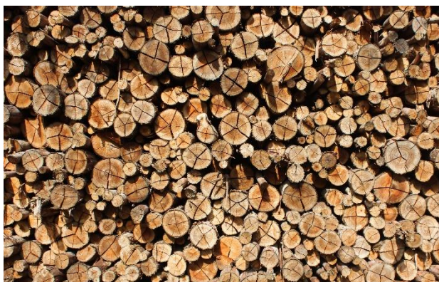
Textura II. Passa Quatro – MG.