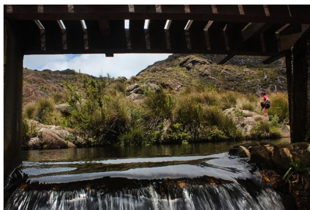
Sob o véu da água corrente. Itamonte – MG.