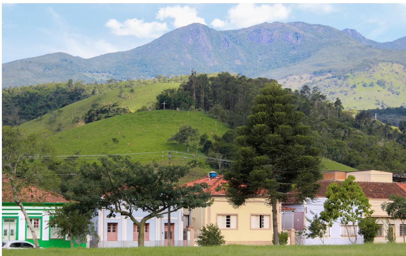
Arquitetura em prolongamento. Passa Quatro – MG.