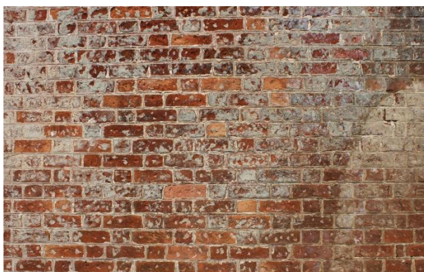
Textura IV. Passa Quatro – MG.