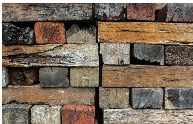
Textura III. Passa Quatro – MG.