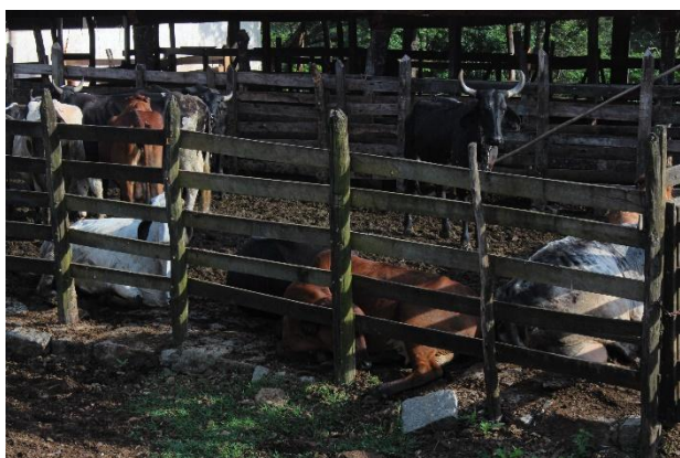
Odor, peso e silêncio entre os corpos. Itamonte – MG.