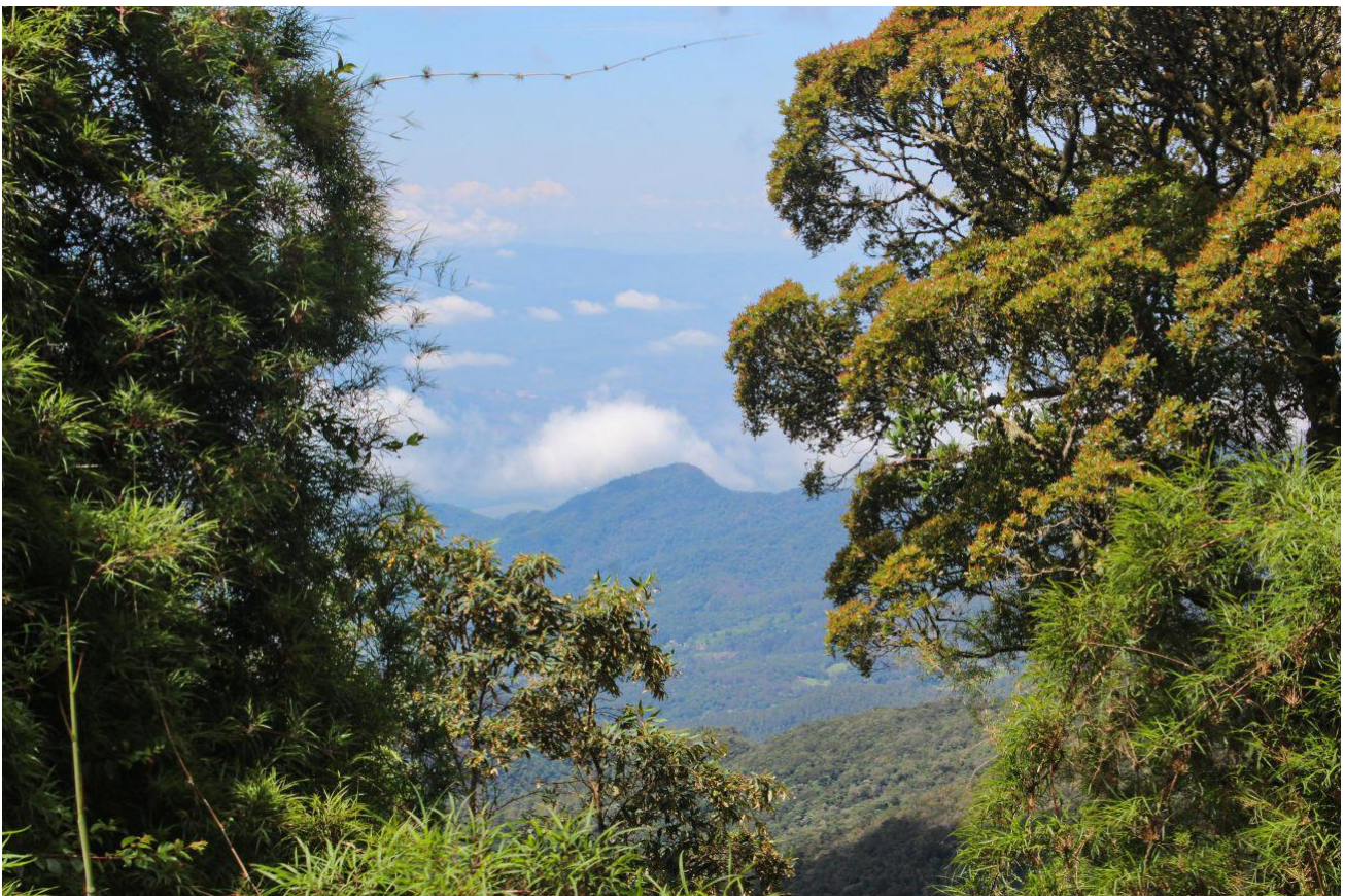
Moldura. Itamonte – MG.