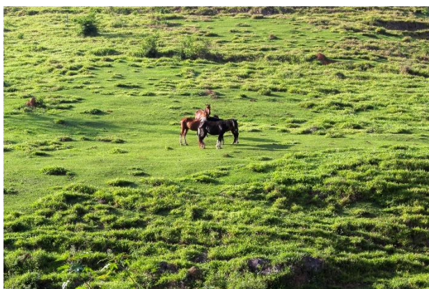
O mundo repousa sob o silêncio da tarde. Itamonte – MG.