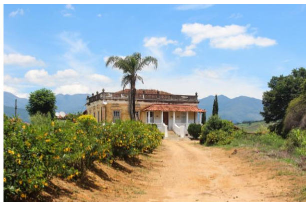
A casa floresce da terra. Itanhandu – MG.