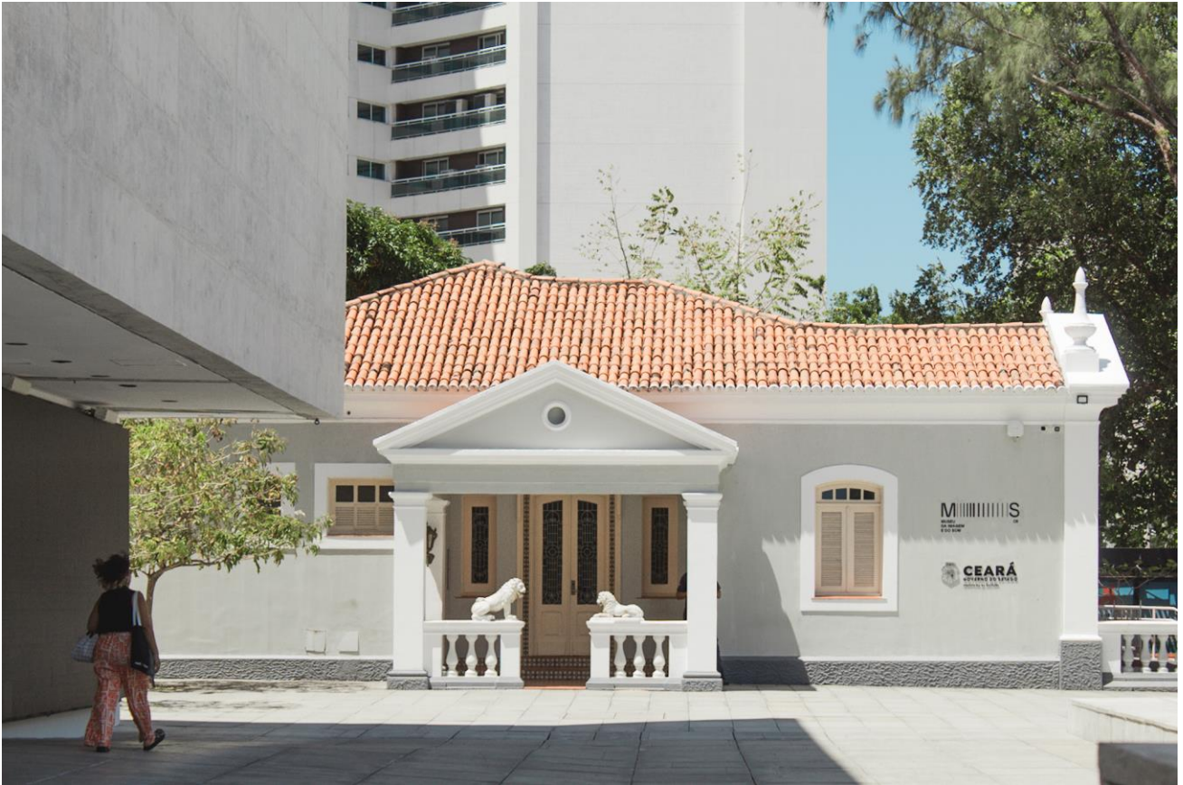
Título: A integração entre o velho e o novo, usos que transformam. 2024