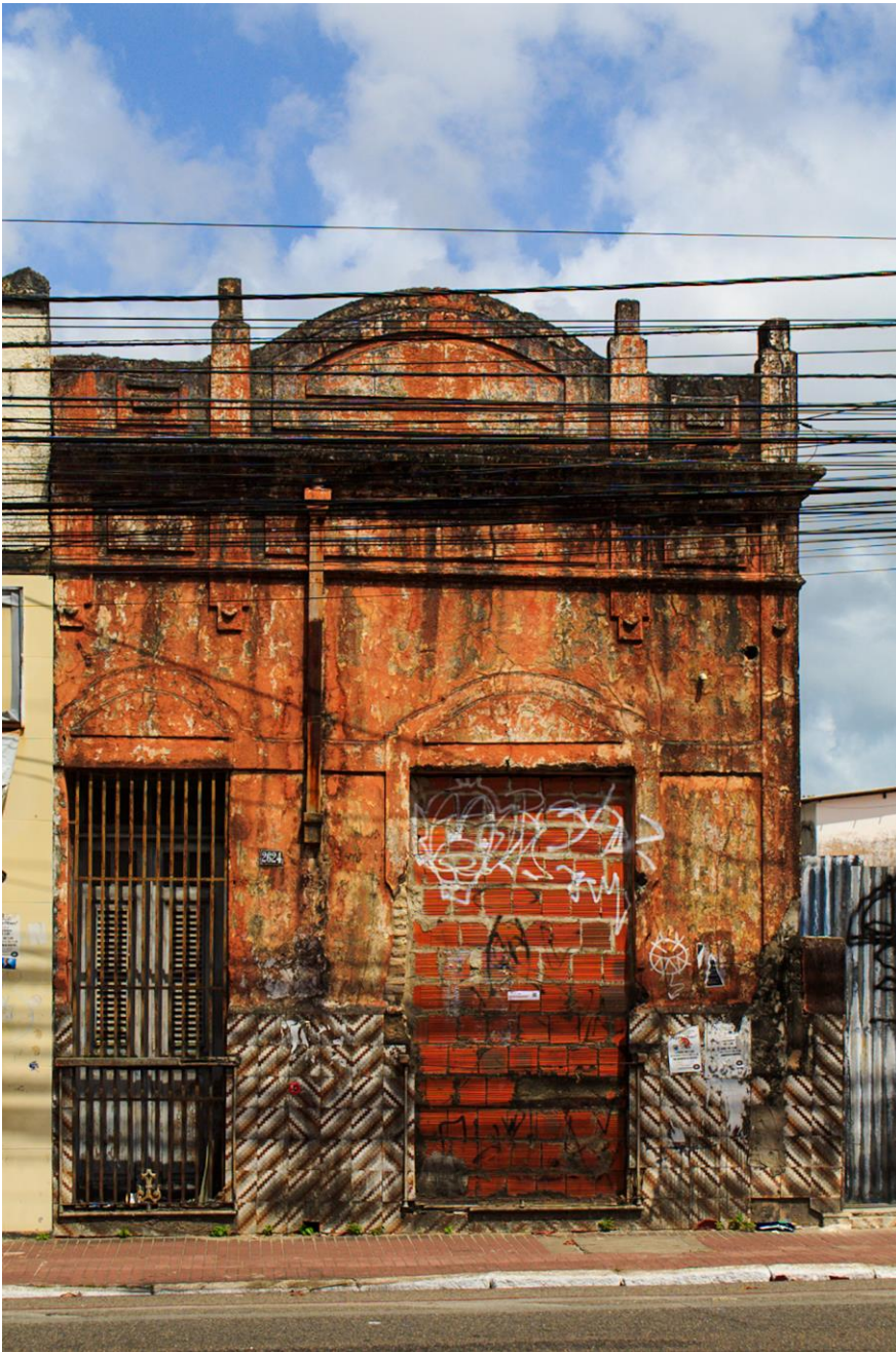
Título: Casarões abandonados pelas ruas do bairro Benfica. 2024