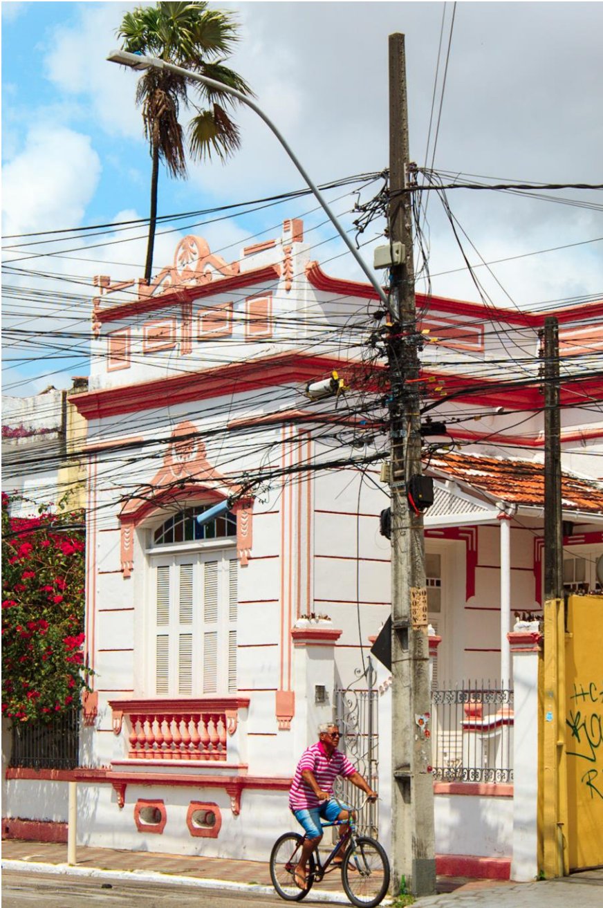
Título: Entre cores e contraste, a vida continua e o velho prevalece. 2024