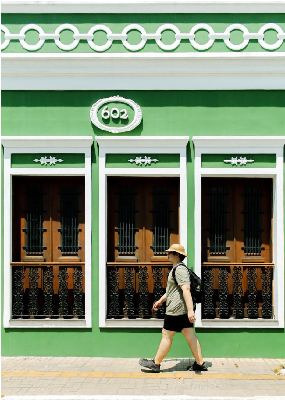
Título: A escala humana e os novos usos do patrimônio edificado. 2024