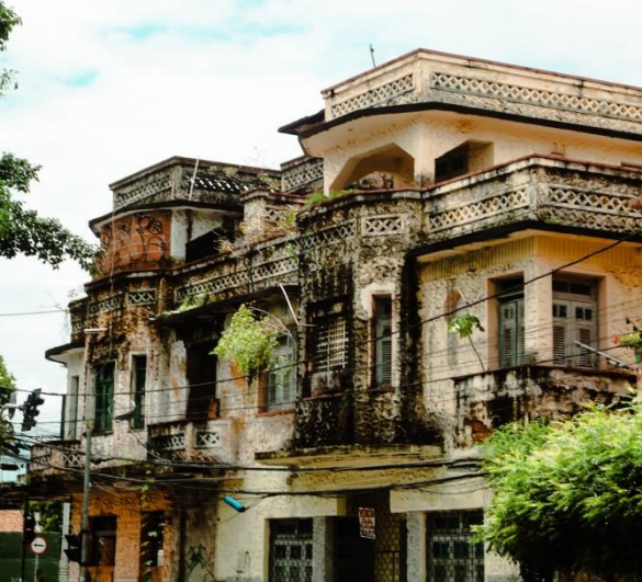
Título: Casarões de Emílio Hinko de meados do século XX. 2024