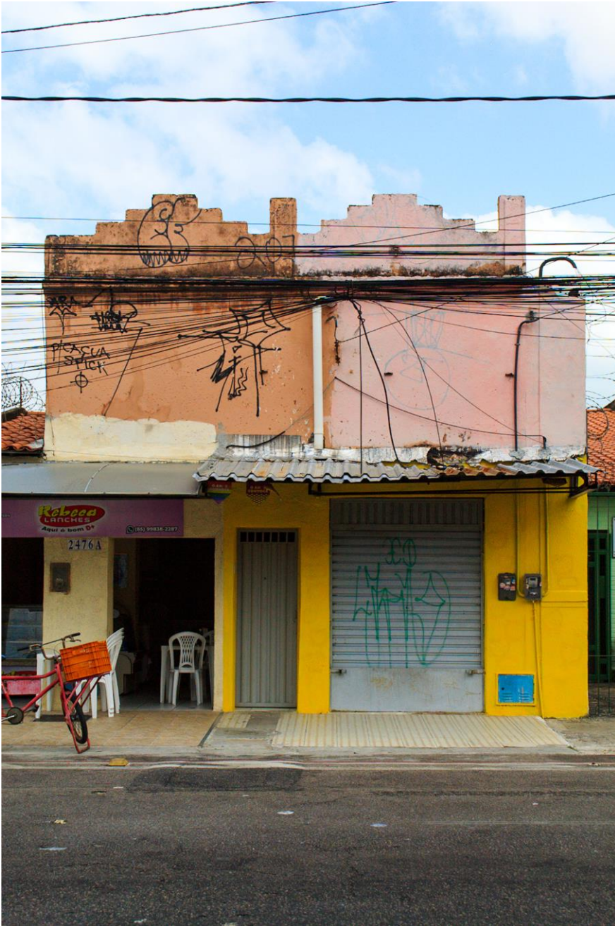
Título: Entre novos usos e a desvalorização das visuais. 2024