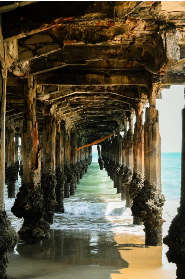
Título: Ponte metálica, patrimônio histórico da cidade, em risco de desabamento. 2024