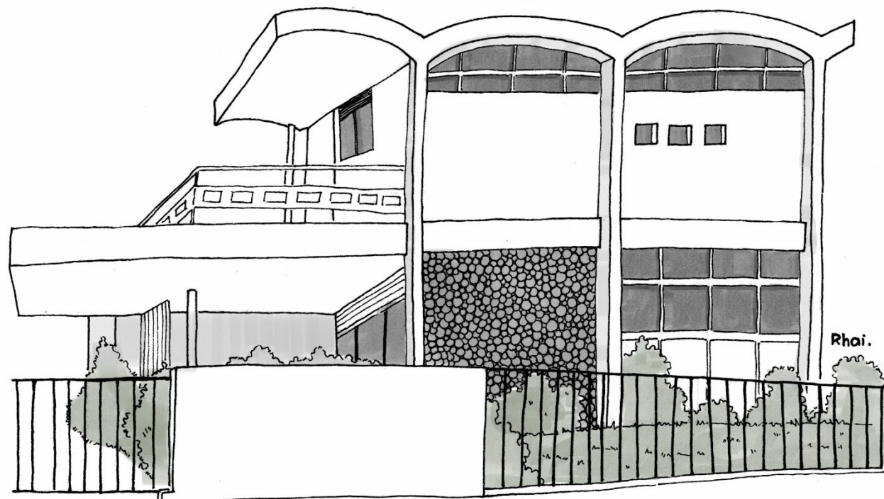
Residência nº 333, localizada na Rua Vila Nova da Rainha, no Centro de Campina Grande-PB