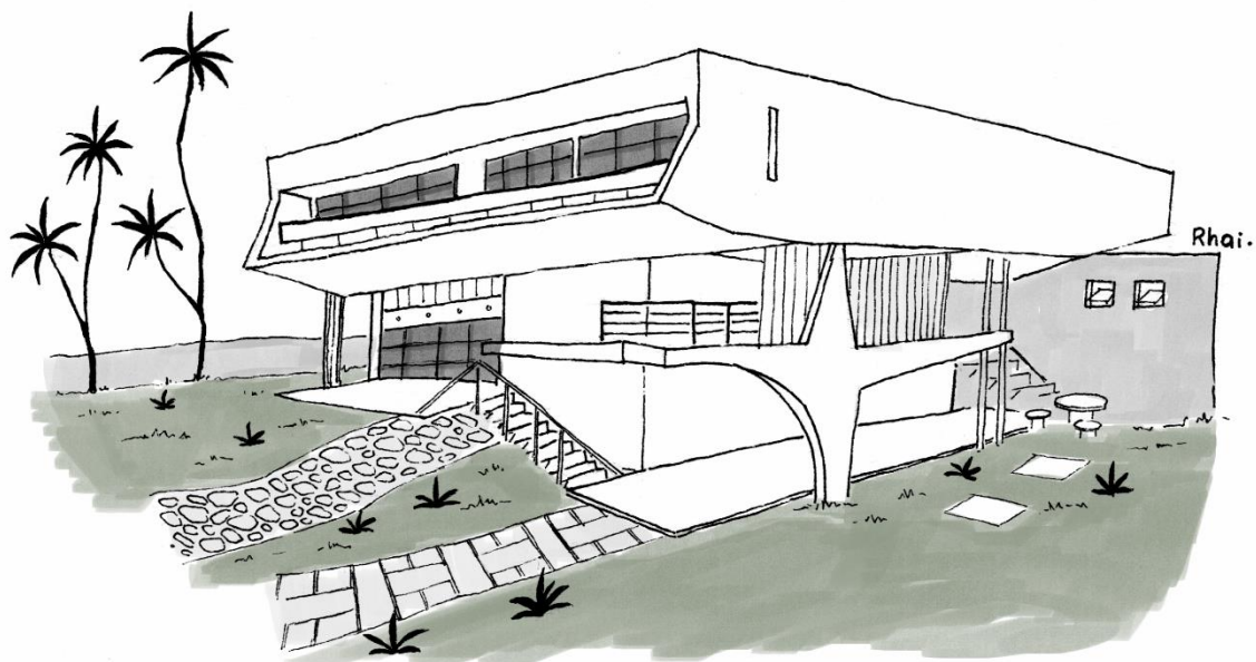
Residência Hélión Paiva