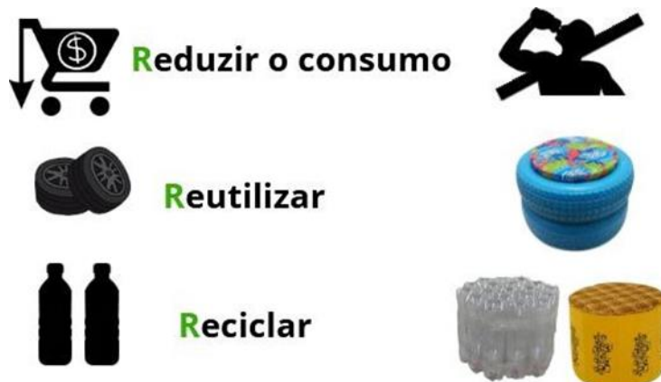
Figura 2. Ilustração da filosofia dos 3R's utilizada por Iwamura

[...] A melhor opção é reduzir o consumo; a segunda é reutilizar os objetos de formas inusitadas – como o emprego de garrafas de vidro ou pneus em paredes; e finalmente, a reciclagem de materiais é a forma mais bem-aceita pelos usuários, pois permite um acabamento construtivo semelhante ao obtido pelo material original, comprometendo menos a estética arquitetônica. (Iwamura, 2008, apud Moletta, 2017, p. 162).