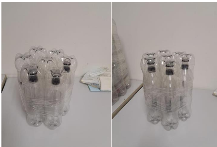
Figura 7. Protótipo de cadeira com encosto