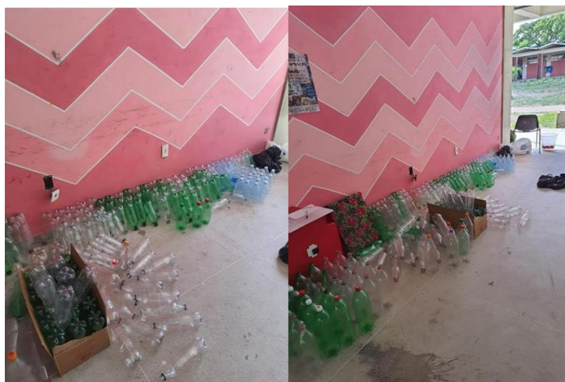
Figura 5. Processo de separação volumétrico e por tipo de garrafa

A oficina piloto foi realizada no dia 25 de março de 2023, um sábado, no período da tarde, em um espaço do bloco de Arquitetura da UFPB. Reuniram-se seis participantes do grupo de trabalho, que cooperaram mutuamente durante a atividade. A primeira ação realizada foi a higienização completa de todas as garrafas, o que inclui lavagem, retirada e descarte dos rótulos, além da separação das tampas, que também passaram por processo de limpeza. Em seguida, as garrafas foram separadas de acordo com a capacidade volumétrica e o modelo, como mostrado na Figura 5, para que pudessem ser utilizadas de uma maneira mais eficaz durante a confecção dos mobiliários.