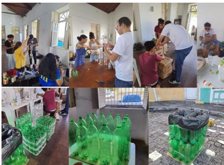
Figura 10: Momento teórico e prático da oficina

No segundo dia, a oficina foi transferida para um novo local, onde todos se reuniram novamente para dar continuidade e finalização ao trabalho. As confecções dos mobiliários foram retomadas, e em questão de horas, a maior parte dos móveis já estava praticamente concluída, necessitando apenas de alguns acabamentos finais. Além da reutilização das garrafas PET, também optou-se por montar cortinas decorativas utilizando CDs e DVDs velhos. Devido ao tempo limitado, nem todos os mobiliários confeccionados puderam receber o acabamento idealizado (revestimento, pintura e/ou cobertura), com os toques finais necessários. A Figura 10 traz também uma série de imagens que retratam as ações da oficina no segundo dia.