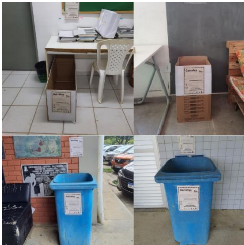
Figura 4. Pontos de coleta de garrafas PET no Campus I da UFPB