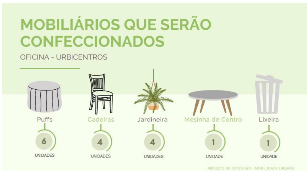
figura 8. Slide da apresentação para os participantes da oficina

A última fase da organização envolveu a montagem da apresentação que seria compartilhada com os participantes da oficina (Figura 8). Para isso, foram coletadas e reunidas diversas informações relevantes acerca dos resíduos sólidos, sobre as diversas etapas do sistema de gerenciamento de resíduos sólidos visando fornecer um panorama abrangente sobre o tema. Abordou-se definições sobre os diferentes tipos de resíduos, passando pelos processos de produção existentes e as diversas formas de acondicionamento, incluindo as práticas recomendadas para o armazenamento adequado. Além disso, a apresentação também abordou a relevância da coleta seletiva, bem como a reutilização dos resíduos sólidos de maneira sustentável. Explorou-se ainda alternativas e exemplos de como esses materiais podem ser transformados em novos produtos, como a confecção de mobiliários urbanos.