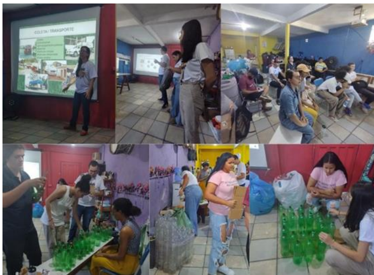
Figura 9. Momento teórico e prático da oficina

Após essa etapa introdutória, os participantes foram apresentados ao material preparado e receberam instruções detalhadas sobre o passo a passo da confecção dos mobiliários. Com base nesses conhecimentos, foram formados cinco grupos, cada um responsável por um tipo específico de mobiliário. Cada grupo era composto por, no mínimo, dois participantes e um coordenador da oficina, que desempenhava o papel de orientador e instrutor durante todo o processo. A Figura 9 traz uma série de fotos tiradas durante os momentos que aconteceram no primeiro dia de oficina.