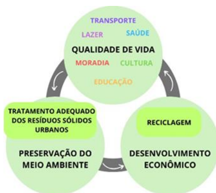
Figura 1. Conceito de Cidade Sustentável segundo Natália Ilson

práticas inteligentes e eficientes para a melhoria da qualidade de vida da população, de modo a promover desenvolvimento econômico, aliado à preservação ambiental. Estes três elementos principais (Figura 1) integrados, qualidade de vida da população, (saúde, transporte, moradia, infraestrutura, cultura, lazer, etc.), preservação do meio ambiente e adoção de planejamento urbano, concorrem para o desenvolvimento econômico eficiente e com impacto positivo, tanto para sociedade, quanto para o meio ambiente.