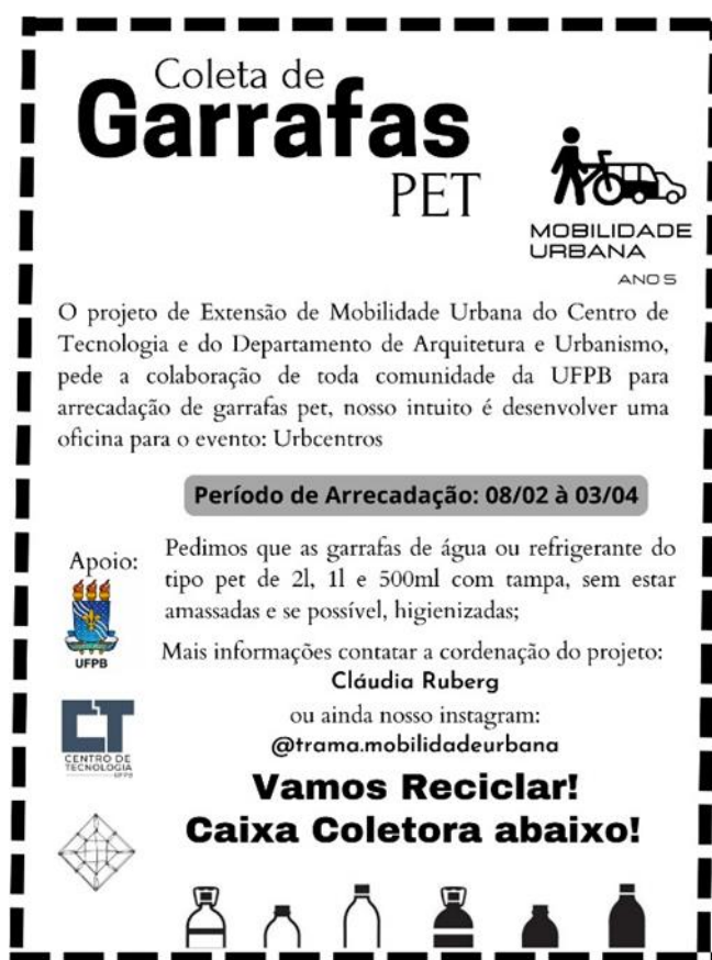
Figura 3. Cartaz da campanha, colocado na UFPB

O primeiro passo para o desenvolvimento da oficina foi definir qual seria o seu plano de ação. Dessa forma, o grupo decidiu em reunião que seria abordada a confecção de mobiliários urbanos tendo como matéria-prima principal as garrafas PET pós consumo. Foram levantadas sugestões de como seria possível fazer a coleta dos materiais necessários para a realização do trabalho. A opção escolhida foi a arrecadação por meio do voluntariado, ou seja, o gerador fazia o descarte voluntário da garrafa em coletores espalhados em alguns pontos da Universidade Federal da Paraíba (UFPB). O grupo de trabalho confeccionou cartazes, mostrado na Figura 3, para colagem em pontos estratégicos da universidade, além de realizar publicações para as redes sociais, divulgado principalmente no Instagram do grupo de extensão sobre mobilidade urbana (@trama.mobilidadeurbana), informando acerca dos locais de descarte e o período para que essa ação fosse realizada.