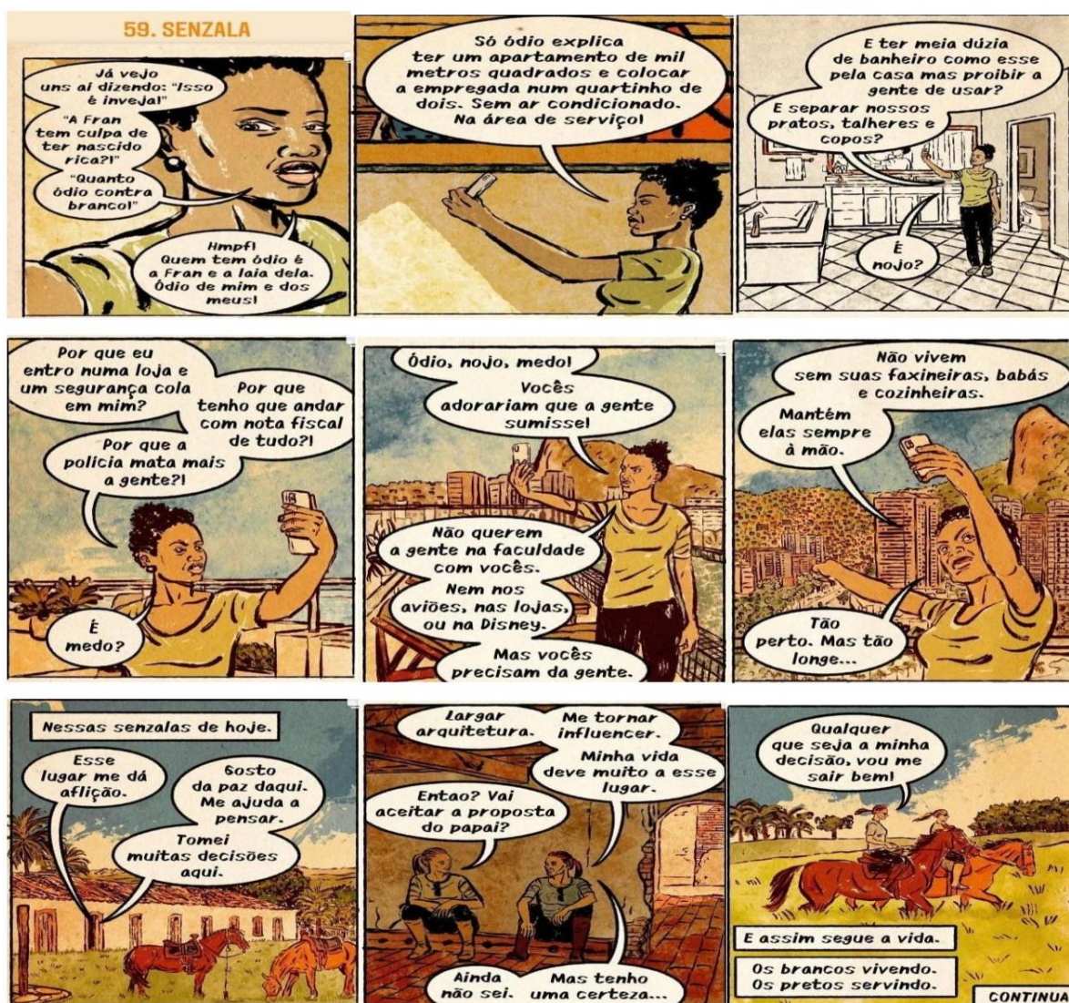
Figura 1: Série em quadrinho Confinada N.59 Senzala

Fonte: Quadrinhos - ilustrações no Instagram leandro_assis_ilustra, 2020